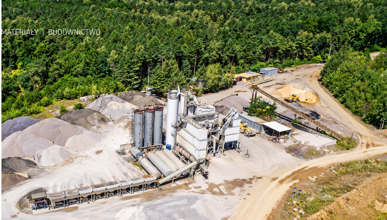
Zakład produkcyjny ADD Asfalt w Kopalni Diabazu Niedźwiedzia Góra

Ogromne doświadczenie i rozumienie rynku mas bitumicznych w połączeniu z wyjątkowym nakładem związanym z realizacją dobrych produktów i usług to jednoznaczna charakterystyka spółki.