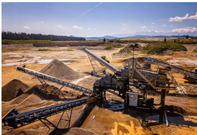
Zakład produkcyjny MKM Kruszywa

MKM Kruszywa – produkująca kruszywa łamane i żwirowe na terenie powiatu nowotarskiego. MKM Kruszywa to spółka o ustabilizowanej pozycji na lokalnym rynku inwestycji drogowych i branży betonowej. Dzięki lokalizacji na złożu żwirowym znajdującym się w starorzeczcu rzeki Białki wydobywane i przetwarzane kruszywa pozwalają na produkcję zarówno kruszyw łamanych, jak i kruszyw żwirowych. Zainstalowany nowoczesny zakład przeróbki kruszyw pozwala na wielostopniowe kruszenie, przesiewanie na mokro i płukanie w płucze mieczowej kruszyw, dając w efekcie produkty o najwyższej jakości. Stabilna pozycja rynkowa oraz doskonale zgrana kadra, w połączeniu z pasją do pracy i poszanowaniem dla klientów tworzy niepowtarzalną atmosferę, dając po latach koniecznych i trudnych zmian satysfakcję oraz tak potrzebne w biznesie zyski. Jak wspominałem na wstępie, trudne wychowawczo dziecko przeistoczyło się w końcu, po pierwszym okresie braku koncepcji i perspektyw oraz drugim okresie zmian, w dochodowe przedsiębiorstwo, posiadające własną tożsamość, związane z rynkiem oraz budujące dobrą partnerską współpracę ze wszystkimi partnerami biznesowymi. Przedsiębiorstwo dysponujące w pełni dostosowanym do prowadzenia działalności sprzętem i wyszkoloną kadrami.