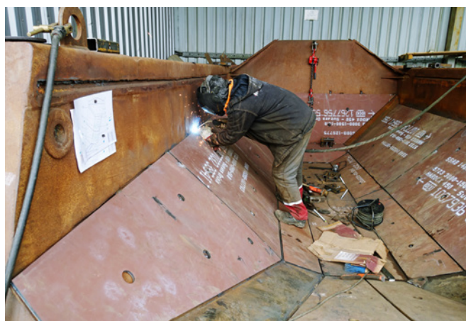
Remont maszyny na terenie zakładu MGTechnic

MGTechnic – powstała z pasji do maszyn. Taką też myśl przewodnią można spotkać w każdej informacji o spółce. Drugim mottem, które przyświeca działalności spółki są słowa Gottlieba Deimlera „besten oder nicht” – najlepiej albo wcale. Dlatego też mieszanina pasji i dążenia do wykonywania działalności najlepiej jak można są ideą spółki. Ideą, której osiągnięcie jest celem koniecznym do osiągnięcia zarówno dla przyszłości spółki, jaki i dla dobra klientów. Spółka posiada trzy główne kierunki działalności. Pierwszym jest produkcja maszyn i urządzeń dla przemysłu wydobywczego w postaci elementów zakładów przerobczych, takich jak kosze główne zasypowe, kosze pośrednie przeładunkowe, przesypy stałe i regulowane, przenośniki taśmowe stacjonarne i zakreślne, projekty rozwiązań i modernizacji układów przesypowych, konstrukcje wsporcze pod maszyny według projektu zleceniodawcy bądź własnego. Drugim kierunkiem działalności jest świadczenie usług serwisowych maszyn budowlanych wraz z dostawą części zamiennych. Spółka wykonuje naprawy kompleksowe maszyn budowlanych bieżące jak i główne, u klienta oraz na terenie własnej bazy serwisowej. Trzecim, nowym kierunkiem działalności spółki jest sprzedaż nowych maszyn i urządzeń, części zamiennych i usług serwisowych dla sektora przetwórstwa odpadów. Spółka jest bowiem autoryzowanym przedstawicielem na rynek Polski produktów firmy Arjes Impaktor GmbH. Stale powiększające się zaplecze