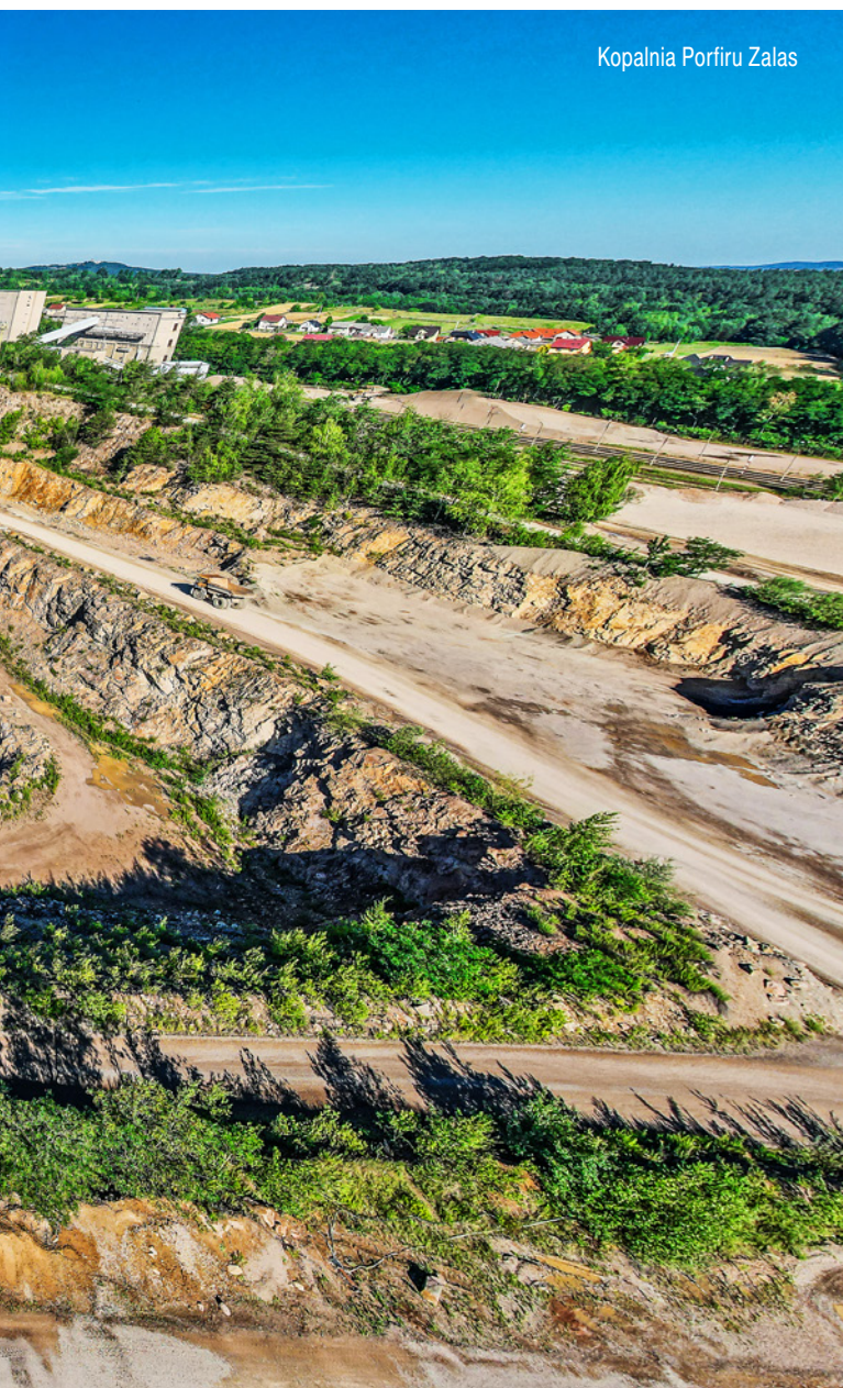
Kopalnia Porfiru Zalas

ADD Asphalt – produkująca mieszanki mineralno-asfaltowe na gorąco, mieszanki kolorowe, mieszanki mineralno-asfaltowe na zimno do napraw cząstkowych. ADD to również wykonawca robót drogowych. Siedzibą spółki jest Kraków. Wytwórnia mas bitumicznych znajduje się w Tenczynku na terenie Kopalni Diabazu Niedźwiedzia Góra. Personel ADD to sprawdzeni fachowcy, od lat działający w branży drogowej. Można śmiało powiedzieć, że w ich żyłach krwi jest niewiele – większość to asfalt (ciekaw jestem, co wpiszę, jak powstanie betoniarnia...).