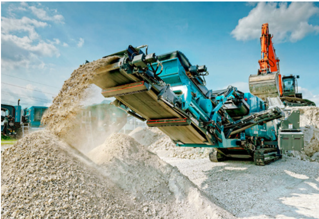
Oferta maszynowa POWERSTONE