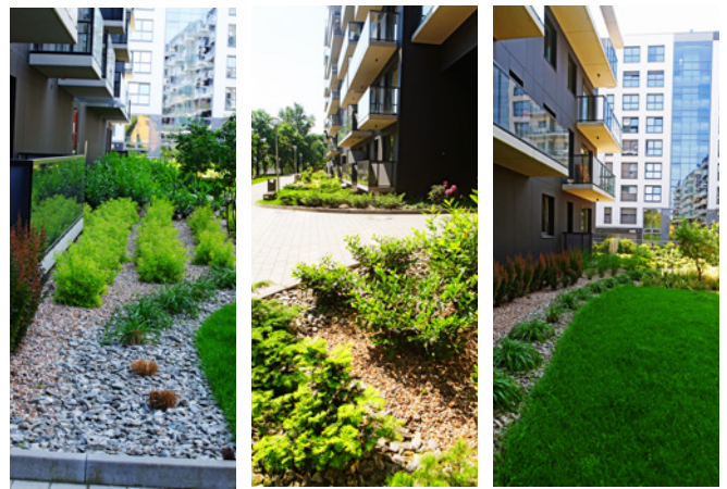
Przykłady realizacji Fabryki Substratu