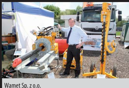
Wamet Sp. z o.o.