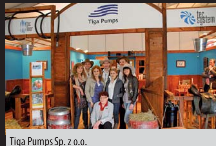
Tiga Pumps Sp. z o.o.

Miło było spotkać dawnych znajomych, poznać nowych. Nawet deszcz, który towarzyszył ekspozycji w pierwszym targowym dniu, nie zniechęcał. No cóż, targi to przecież miejsce spotkań ludzi związanych z wodą. Było zimno? Gorące dyskusje prowadzone na stoiskach rozgrzały każdego.