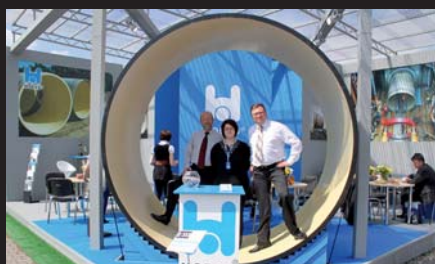
Hobas System Polska Sp. z o.o.