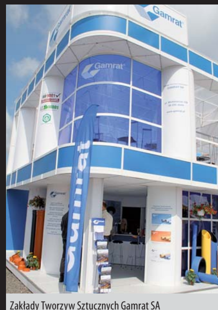
Zakłady Tworzyw Sztucznych Gamrat SA