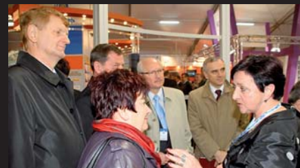
Keramo Steinzeug N.V.