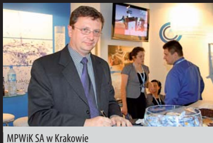
MPWIK SA w Krakowie