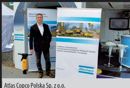
Atlas Copco Polska Sp. z o.o.