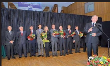
Uroczysta gala oraz laureaci