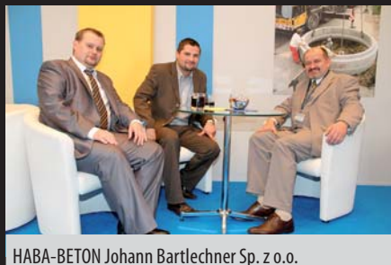
HABA-BETON Johann Bartlechner Sp. z o.o.