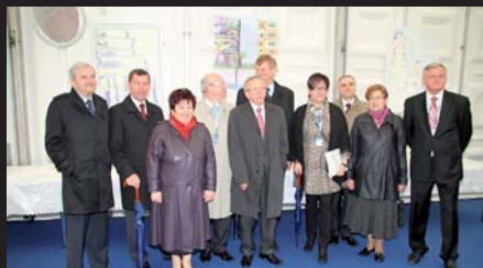
Otwarcie targów WOD-KAN

Dobiegły końca XVIII Międzynarodowe Targi Maszyn i Urządzeń dla Wodociągów Kanalizacji WOD-KAN 2010 w Bydgoszczy. Radosny czas spotkania jest już za nami. Jak zwykle w takich chwilach pozostaje żal, że to wielkie branżowe święto tak szybko stało się historią, ważnym, ale już tylko kolejnym etapem zarówno w życiu organizatora – Izby Gospodarczej „Wodociągi Polskie”, jak i wystawców oraz odwiedzających targi gości. Nadszedł czas podsumowań i rozliczeń.