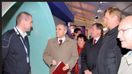
Amitech Poland Sp. z o.o.