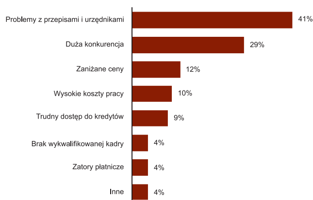
Co najbardziej utrudnia działalność na rynku budowlanym w Polsce?

Uwzględniono odpowiedzi 98 respondentów. Pytanie otwarte.