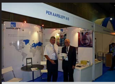
Stoisko wystawiennicze firmy Per Aasleff, gościem firmy był m.in. autor artykułu (z prawej)