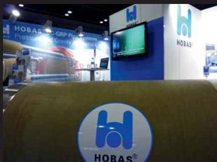
Fragment stoiska wystawienniczego firmy Hobas