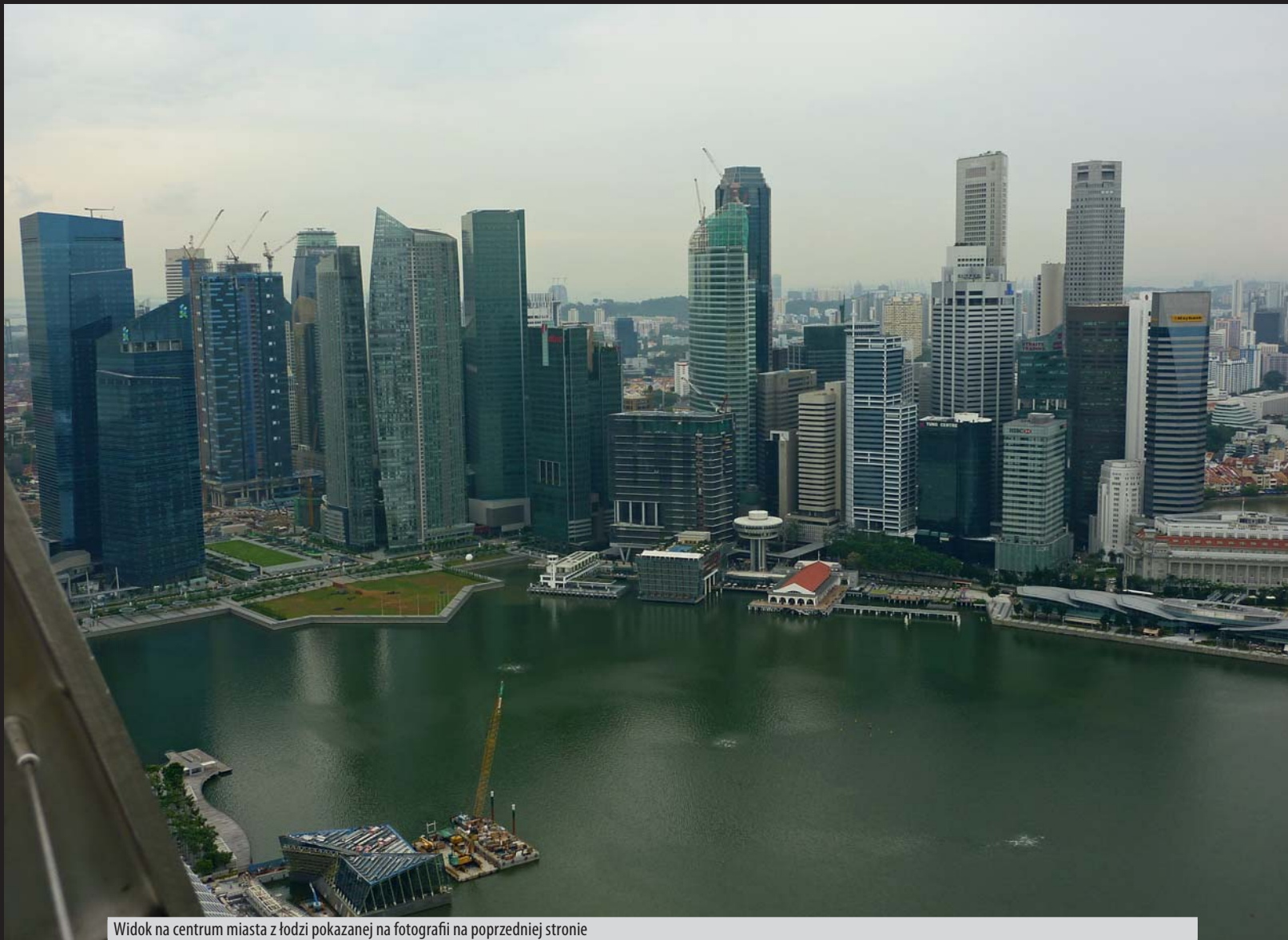
Widok na centrum miasta z łodzi pokazanej na fotografii na poprzedniej stronie

dwóch ogólnoświatowych konferencji NO-DIG: São Paulo w Brazylii w 2012 r. i Sydney w 2013 r.