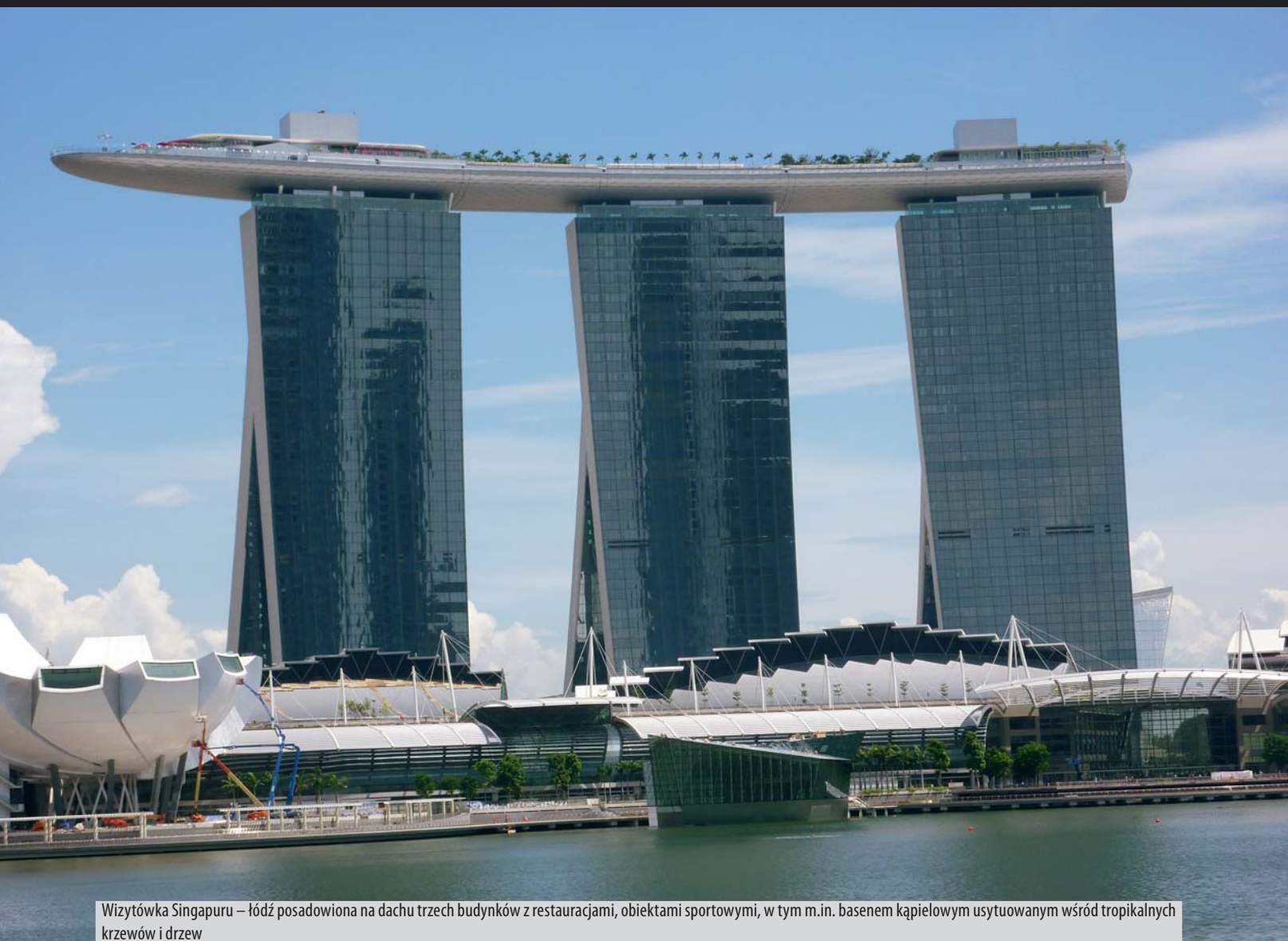
Wizytówka Singapur – łódź posadowiona na dachu trzech budynków z restauracjami, obiektami sportowymi, w tym m.in. basenem kąpielowym usytuowanym wśród tropikalnych krzewów i drzew