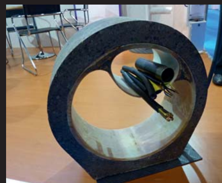
Dwuprzekrojowe utwardzane in situ powłoki żywiczne

Z zainteresowaniem spotkała się także oferowana przez jedną z firm amerykańskich technologia renowacji lub rekonstrukcji różnych budowli sanitarnych, w tym przewodów wodociągowych, polegająca na natrysku ich powierzchni żywicami poliuretanowymi o różnych