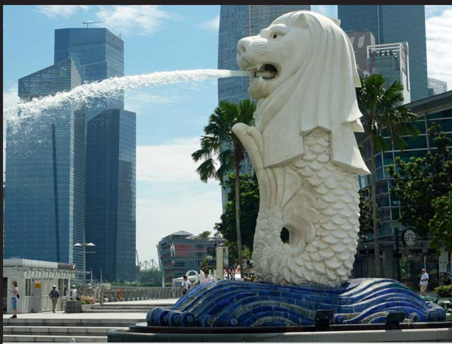
Singapurski Merlion – odpowiednik warszawskiej Syreny

Te rozwiązania oraz szereg innych zaprezentowanych na konferencji i wystawie w Singapurze zostaną szczegółowo omówione na kolejnym szkoleniu bezwykopowym, które odbędzie się w Warszawie w lutym 2011 r. (szczegóły na stronie: www.kuliczkowski.eu ).