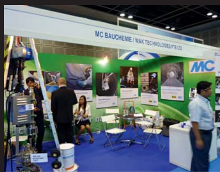
Urządzenie natryskowe firmy MC-Bauchemie