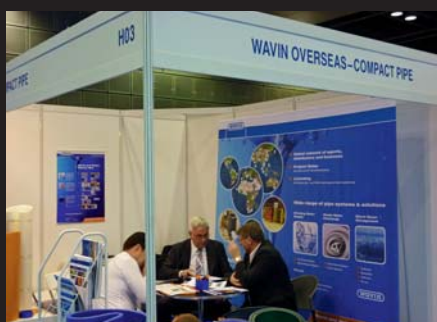
Stoisko wystawiennicze firmy Wavin