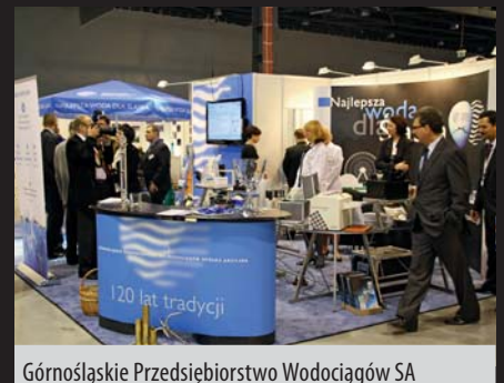
Górnśląskie Przedsiębiorstwo Wodociągów SA

Na targach nagrodzono Medalami Expo Silesia najlepsze produkty prezentowane przez wystawców. Były to: zwięzka KAMA-euro firmy Grupa Kama-Eko SA oraz łączniki uniwersalne SUPA MAXI™-AVK firmy PPUH Hefar Sp.j. W tej samej kategorii przyznano także wyróżnienia: dla Wavin Metalplast-Buk Sp. z o.o. za INTESIO – inteligentne rozwiązania do zagospodarowania wód deszczowych oraz dla PP Insbud-Rybnik