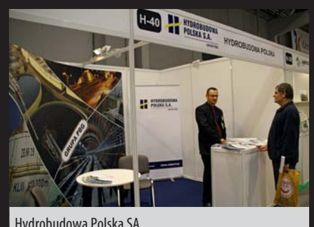
Hydrobudowa Polska SA

II za łócznie STRATE AWALIFT 80. Ponadto na targach wyróżniono firmę Krevox Europejskie Centrum Ekologiczne za efektowny sposób prezentacji targowej.