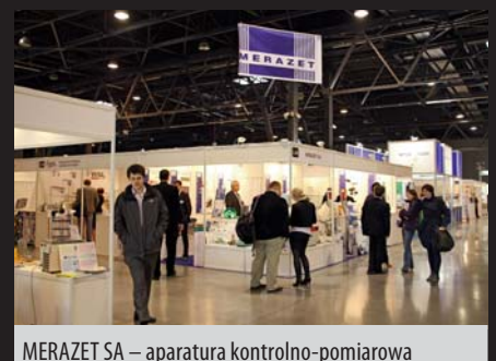
MERAZET SA – aparatura kontrolno-pomiarowa