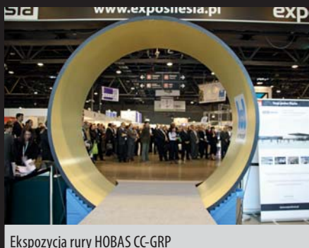
Ekspozycja rury HOBAS CC-GRP