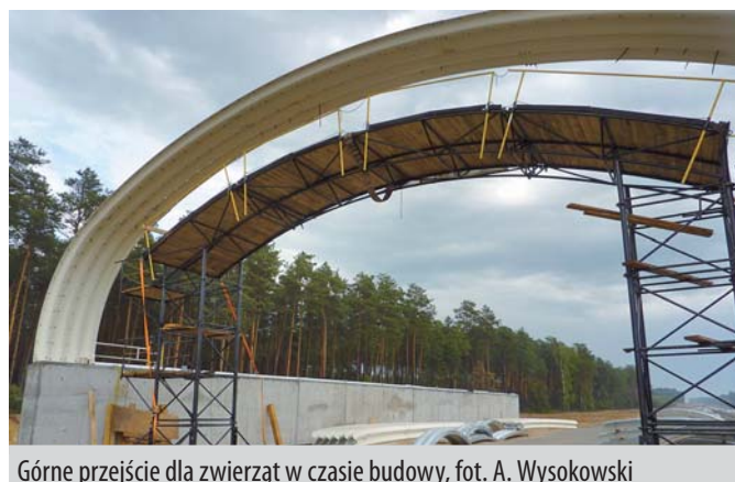
Górne przejście dla zwierząt w czasie budowy

Przepusty i przejścia dla zwierząt są istotne z uwagi na planowane inwestycje w zakresie infrastruktury komunikacyjnej oraz sukcesywne podnoszenie standardów jej utrzymania. Jak wielokrotnie podkreślałem, przepusty w ciągach komunikacyjnych są jak „młodszy, mniejszy bracia mostów”. Dlatego też najprawdopodobniej z tego powodu poświęca się tym obiektom mniej uwagi. Wystarczy porównać liczbę publikacji, które ukazują się na temat mostów, z liczbą tekstów poświęconych przepustom i przejściom dla zwierząt. Szybko można zauważyć, że istnieje luka informacyjna w tym zakresie.