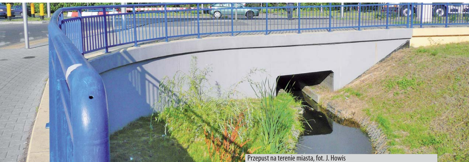
Przepust na terenie miasta