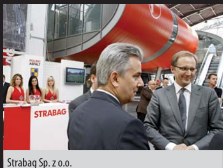
Strabag Sp. z o.o.

Słowa te nieprzypadkowo padły w Kielcach. Tam bowiem po raz kolejny zawitali przedstawiciele największych na świecie firm związanych z branżą budownictwa drogowego. 10–13 maja 2011 r. na terenach wystawowych Targów Kielce, na powierzchni wystawienniczej ponad 33 tys. m 2 – o ponad 20% większej niż w ub.r. – odbyła się XVII edycja Międzynarodowych Targów Budownictwa Drogowego AUTOSTRADA-POLSKA wraz z towarzyszącymi jej VII Międzynarodowymi Targami Infrastruktury TRAFFIC-EXPO