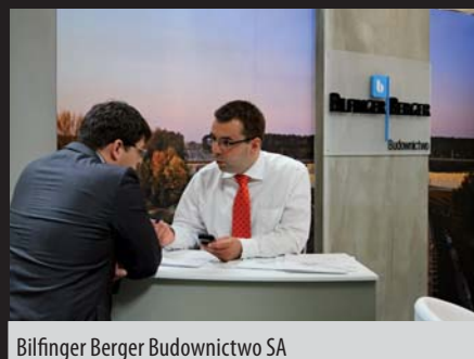
Bilfinger Berger Budownictwo SA