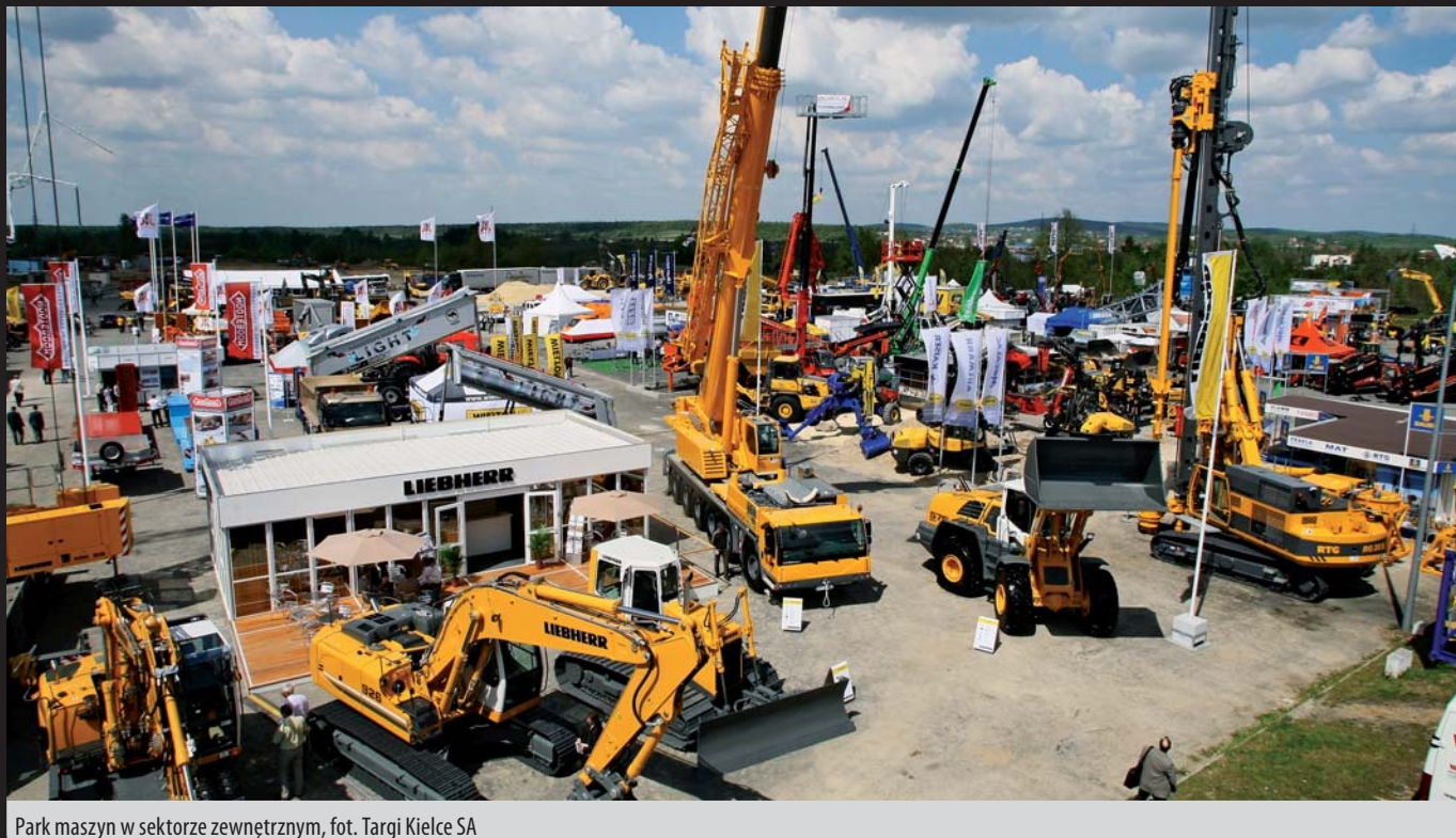
Park maszyn w sektorze zewnętrznym

862 firmy z całego świata, reprezentanci największych światowych marek i koncernów, kilkaset ton sprzętu i ponad 20 tys. zwiedzających – to obraz tegorocznej, rekordowej edycji targów AUTOSTRADA-POLSKA.