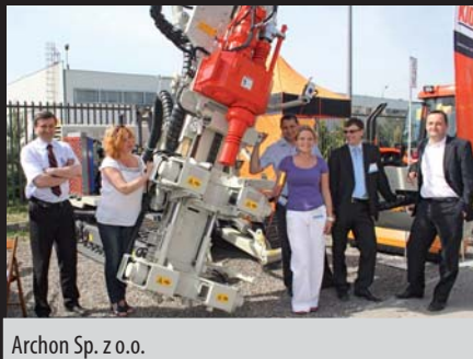
Archon Sp. z o.o.

oraz XIII Międzynarodowymi Targami Maszyn Budowlanych i Pojazdów Specjalistycznych MASZBUD.