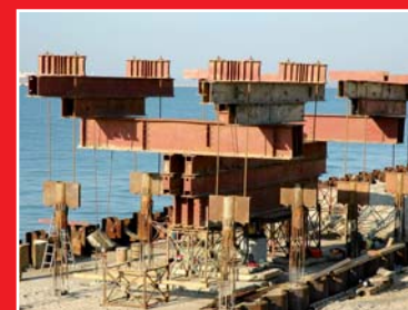
Próbne obciążenia obiektów mostowych i pali fundamentowych. Diagnostyka, przeglądy okresowe obiektów mostowych.