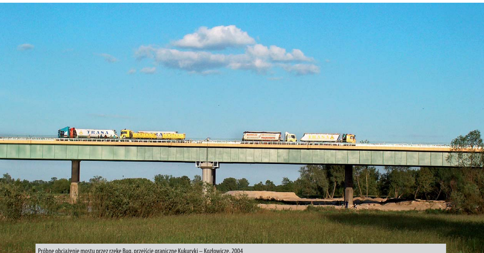
Próbne obciążenie mostu przez rzekę Bug, przejście graniczne Kukuryki – Kozłowice, 2004