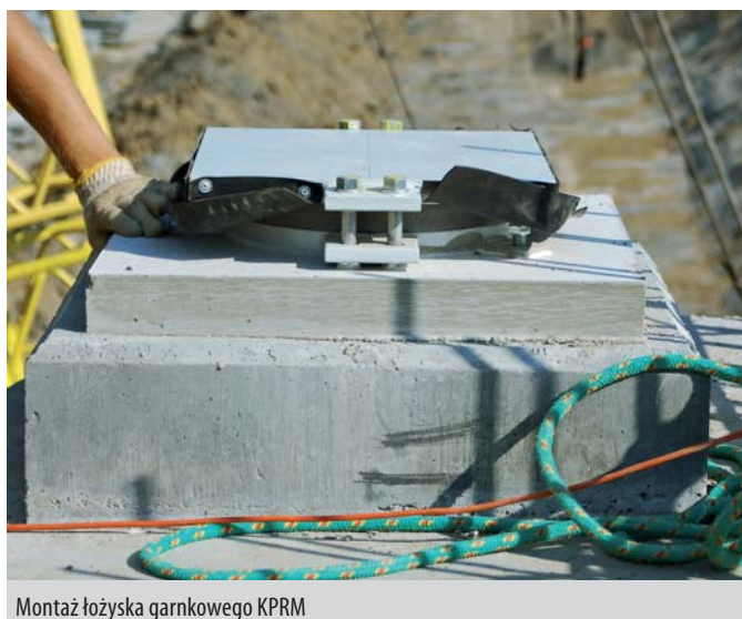
Montaż łożyska garnkowego KPRM

Grupa Mostowa KPRM-Aspekt to mariaż nauki i techniki. I pewna gwarancja wynikła z tradycji dobrej roboty.