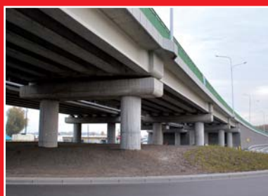
Roboty budowlano - montażowe obiektów mostowych.