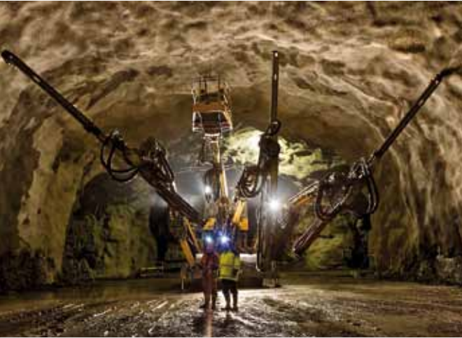
Prace podziemne prowadzone w ramach projektu Citybanan