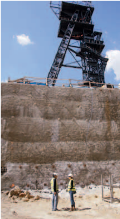
Ryc. 3. Konsultacje projektantki z kierownikiem robót