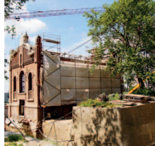
Ryc. 6. Widok obudowy wykopu przy chronionym platanie

działaniom ekipy wykonującej zabezpieczenia ścian. Tempo robót ziemnych oraz ich sposób wykonywania ściśle zależą od przyjętego sposobu zabezpieczenia, reżimów technologicznych oraz warunków gruntowych warstw odsłanianych w miarę postępu robót.