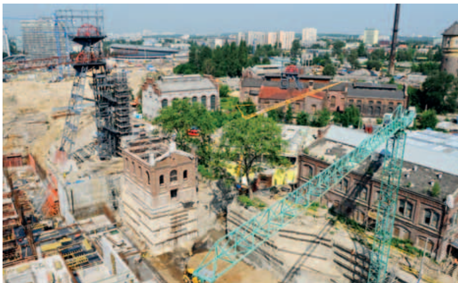
Ryc. 1. Panorama budowy

Artykuł przedstawia zagadnienia związane z projektowaniem i wykonawstwem robót geotechnicznych służących zabezpieczeniu głębokiego wykopu wraz z przylegającymi do niego modernizowanymi obiektami zabytkowymi. W tekście starano się w możliwie kompleksowy sposób przekazać złożoność i wielowątkowość procesu aktywnego projektowania oraz obserwacji stopnia współgrania projektu i wykonawstwa przez rozbudowany, wieloaspektowy system monitoringu.