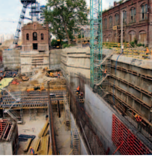
Ryc. 4. Widok w kierunku obiektu MS-8 i szybu Warszawa