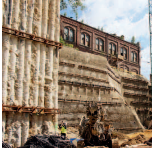
Ryc. 5. Widok w kierunku budynku MS-15