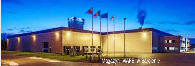
Magazyn MAPEI w Barcinie