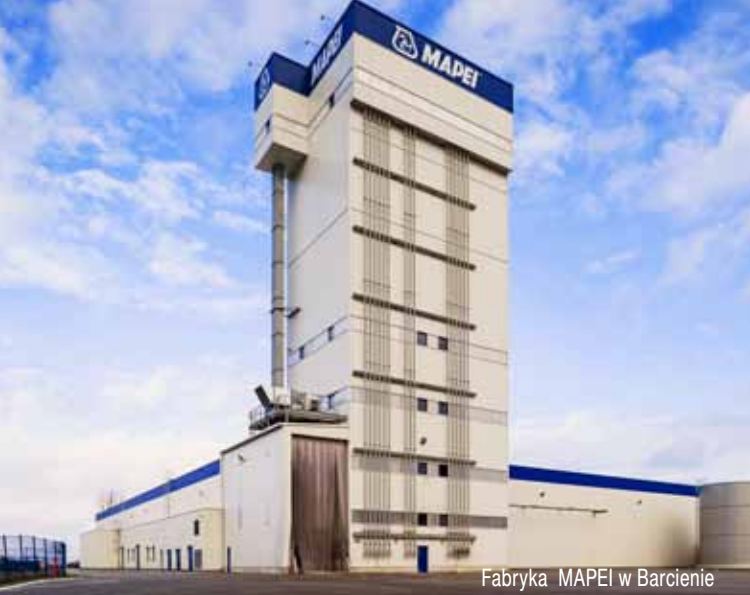
Fabryka MAPEI w Barcinie