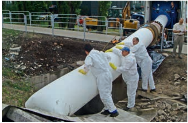
Renowacja rękawem Process Phoenix wodociągu 800 mm wzdłuż al. Górnośląskiej w ciągu autostrady A4 w Katowicach

Istotną sprawą przy tej realizacji jest stosowanie właściwych rur PE. Niewskazane jest stosowanie rur jednowarstwowych. W wyniku powstałych zarysowań na zewnętrznej powierzchni rury podczas wykonywania przewiertu tworzą się źródła propagacji pęknięć, które w przyszłości doprowadzą do degradacji rury. Do realizacji wodociągów w Katowickich Wodociągach S.A. stosowane są rury PE 100, SDR 11 RC z certyfikatem PAS 1075 oraz dopuszczeniem do stosowania na terenach podlegających