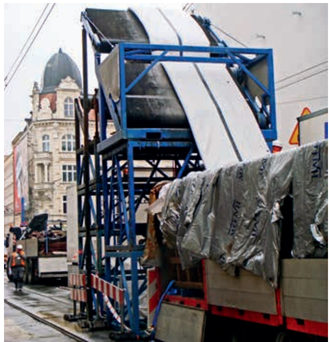
Realizacja ciągu głównego kanalizacji ogólnospławnej w ul. 3 Maja w Katowicach za pomocą rękawa

wpływem eksploatacji górniczej. Niepokojącym zjawiskiem jest fakt legitymowania się przez różnych producentów wymaganym dokumentem dla rur PE, natomiast produkty różnią się między sobą zdecydowanie już samym wyglądem. Celowe wydaje się wymaganie certyfikowania każdej partii produkcji.