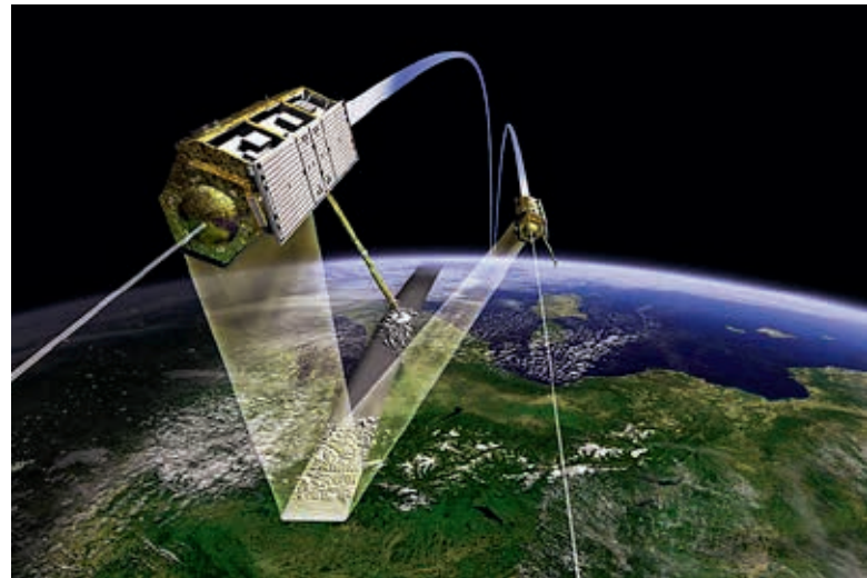
Ryc. 1. Satelity TerraSAR-X i TanDEM-X

Z punktu widzenia szeroko pojętego budownictwa inżynierskiego satelitarne dane radarowe są bardzo użyteczne. Pozwalają one w krótkim czasie pozyskać dane na temat stabilności poszczególnych obiektów lub stosunkowo dużych terenów. Informacje takie są bardzo przydatne podczas planowania, wykonywania i monitoringu istniejących inwestycji inżynierskich, takich jak kopalnie, mosty, wiadukty, budynki itp. Techniki monitoringu osiadań terenu są już tak dobrze rozwinięte i sprawdzone, że stanowią podstawę do świad-