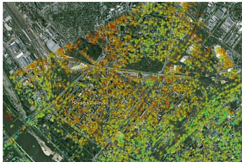
Ryc. 3. Wyniki analizy PSInSAR dla fragmentu Warszawy. Kolor punktu określa prędkość osiadania bądź podnoszenia terenu

czenia komercyjnych usług dla zainteresowanych instytucji i przedsiębiorstw.