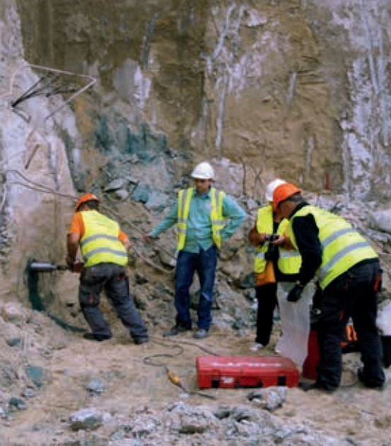
Badania kontrolne laboratoryjne