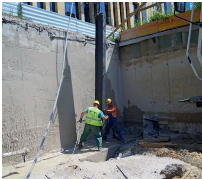
Prace przy przesłonie

Mamy nadzieję, że w przyszłości będziemy mogli Państwu zaoferować naszą wiedzę i doświadczenie, co zwykle prowadzi do optymalizacji kosztów przedsięwzięcia i wspólnych sukcesów w zakresie nowych inwestycji.