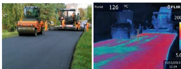
Ryc. 4. Wykonanie pierwszego odcinka doświadczalnego z Orbitonem 65/105-80 HiMA w 2013 r. – rejestracja zmiany temperatury mieszanki podczas zagęszczania, fot. Orlen Asphalt Sp. z o.o.

Kolejnym odcinkiem testowym była nawierzchnia z mieszanki SMA11S na obiekcie inżynieryjnym w miejscowości Kobiór (powiat pszczyński, województwo śląskie), zrealizowana z Orbiton 45/80-80 HiMA. Jesienią 2014 r. wykonano także część obwodnicy Skawiny (warstwę ścieralną z SMA11S) z asfaltem wysokomodyfikowanym Orbiton 45/80-80 HiMA.