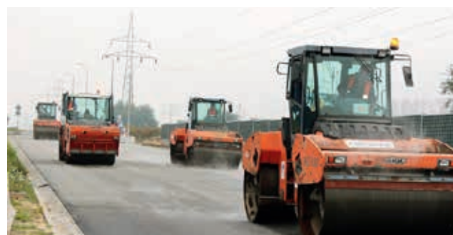
Ryc. 5. Wykonanie odcinka z Orbitonem 45/80-80 HiMA w 2014 r. – nawierzchnia na obwodnicy Skawiny, fot. Orlen Asphalt Sp. z o.o.