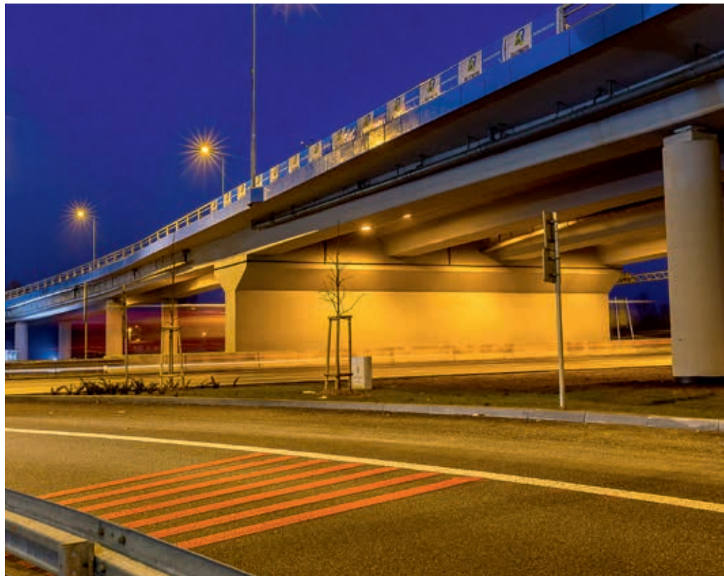
DK 1, Częstochowa, wykonawca Bilfinger Infrastructure SA

Drugi etap – zależności – opiera się na hierarchii. Widoczne jest zaangażowanie zarządu firmy w sprawy BHP, jednak pokutuje pogląd, że wystarczy przestrzegać prawa. Uznanie odpowiedzialności