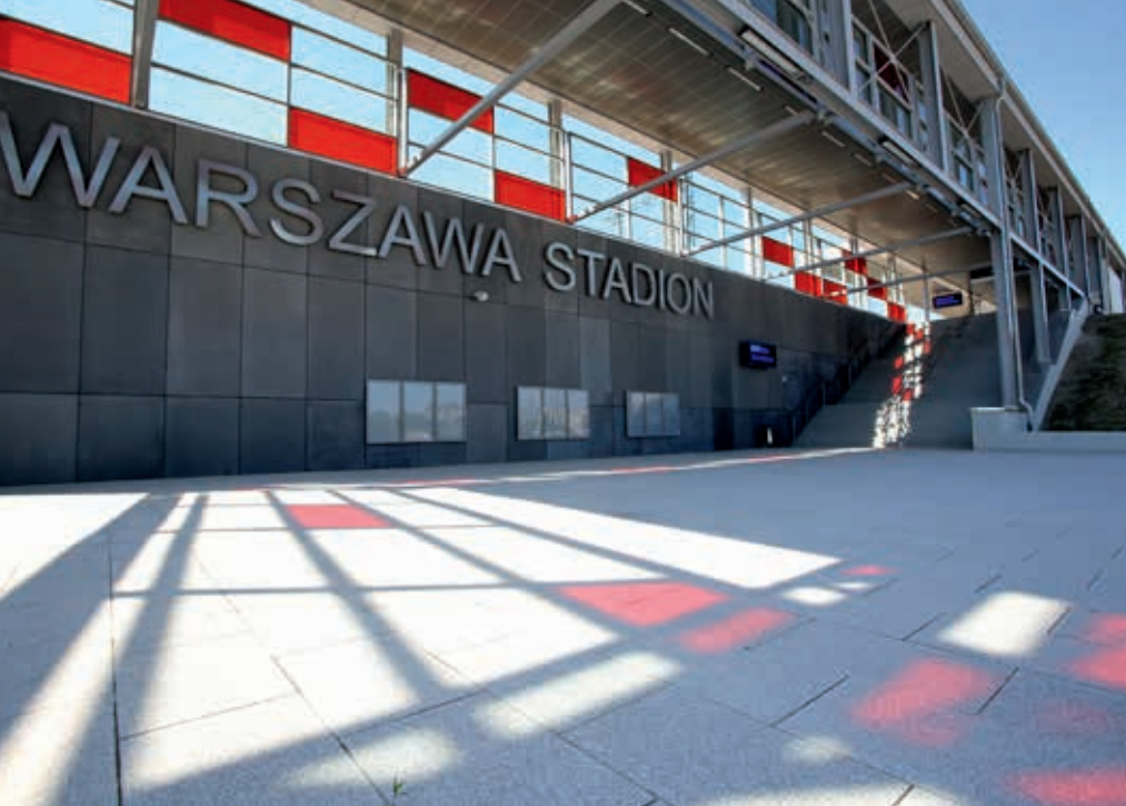
Stacja Warszawa Stadion, wykonawca Bilfinger Infrastructure SA

za bezpieczeństwo przez całą kadrę, ale także postrzeganie przez pracowników bezpieczeństwa jako szeregu narzuconych wymagań (procedury, instrukcje), które z obowiązku trzeba spełnić, powoduje dalsze nieznaczne zmniejszenie liczby wypadków.