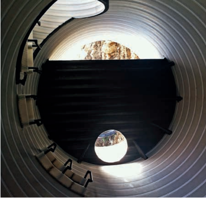
Wnętrze retencyjnego kanału ściekowego z przegradą piętrzącą

pod uwagę, jestem zdania, że rozwiązanie retencyjnego kanału ściekowego jest jak najbardziej uzasadnione, szczególnie w przypadkach dołączania do istniejącej sieci kanalizacyjnej nowych zlewni i wprowadzania dodatkowych ilości ścieków, jak również przy przeciwdziałaniu przeciążeniu hydraulicznemu istniejących sieci i obiektów kanalizacyjnych, a także do regulowania odpływu ścieków do wód powierzchniowych. Fakt ten potwierdzają zarówno wyniki symulacji hydraulicznych z wykorzystaniem modeli hydrodynamicznych, jak i oceny finansowe, które powinny być wykonywane jako ważne części składowe analiz wielowariantowych przeprowadzanych dla każdej planowanej i projektowanej inwestycji.