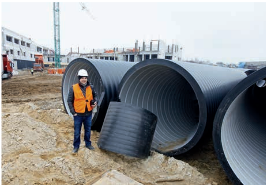
Rury PEHD Weholite wykorzystane do budowy retencyjnego kanału ściekowego na os. Krakowska-Południe w Rzeszowie