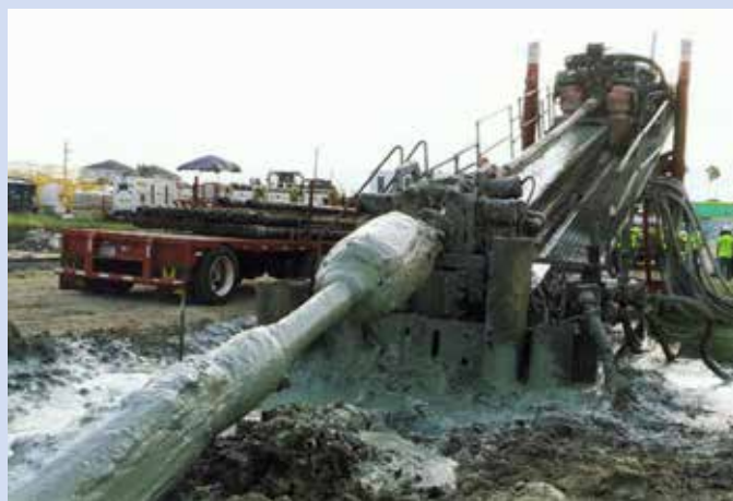
Ryc. 7. Niestabilny grunt okazał się nie lada wyzwaniem, fot. za: „Trenchless International” 2015, nr 27

Szacuje się, że w latach 1940–1960 wbudowano ok. 1 mln km rur azbestowocementowych, zanim odkryto szkodliwy wpływ azbestu na organizm człowieka. Ze względu na jego korzystne właściwości materiałowe azbestocement stosowano na potrzeby kanalizacji sanitarnej, deszczowej oraz do transportu wody pitnej. Niestety, przy przewidywanym czasie wytrzymałości materiałowej, prognozowanym na 50–70 lat, ograniczenie potencjalnego ryzyka i negatywnego oddziaływania na środowisko stało się w przypadku rur azbestocementowych priorytetowym działaniem. W związku z tym zaproponowano rozwiązanie powyższego problemu z użyciem bezwykopowej metody CIPP w przypadku przewodów azbestocementowych nadających się do rehabilitacji (ryc. 8). Jak do tej pory przeprowadzono kilka