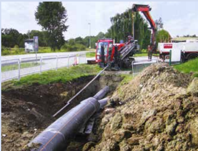
Ryc. 9. Przewiert sterowany pod jezdnią

blisko torowiska kolejowego oraz ogromnego dębu będącego pod ochroną. Na tych etapach budowy zastosowano przewiert sterowany (ryc. 9). Łącznie tą metodą wykonano ponad 1500 m przewodu. Przewiert sterowany wymaga dużych ilości wody. Aby nie wyczerpać możliwości sieci wodociągowej, zbudowano własne zbiorniki sedymentacyjne dla recyrkulacji wody w trakcie prac.