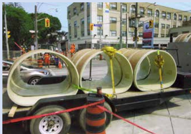
Ryc. 4. Dostarczenie modułów firmy Channeline, fot. za: „Trenchless International” 2015, nr 27

eliptycznego kolektora – na długości ok. 7 m na kształt zbliżony do odwróconego przekroju dzwonowego (ryc. 5). W związku z niskim współczynnikiem chropowatości rur GRP obliczenia zmiany przepływu po rehabilitacji wykazały wzrost przepustowości o 0,3 m 3 /s, co korzystnie wpłynęło na zdolności samooczyszczania kolektora. Zainstalowanie modułów przejściowych – na odcinku zmiany przekroju – trwało jedynie cztery dni (ryc. 6). Moduły zostały wciągnięte po wcześniej zainstalowanych stalowych stelażach, następnie wszystkie połączenia wypełniono żywicą epoksydową.