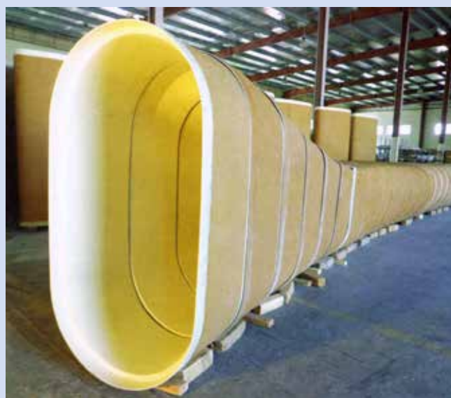
Ryc. 5. Skonstruowany w fabryce odcinek przewodu o zmiennym przekroju