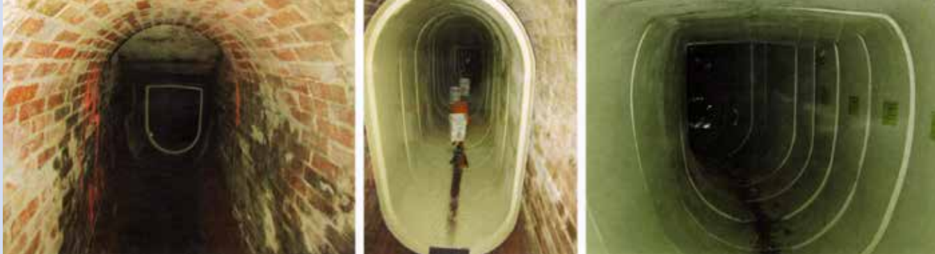
Ryc. 6. Kolejne instalowane moduły przewodu, fot. za: „Trenchless International” 2015, nr 27