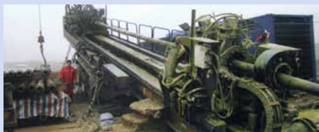
Ryc. 1. Jeden z zespołów wiertniczych