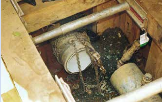
Ryc. 8. Rura azbestocementowa po naprawie, fot. za: „Trenchless International” 2015, nr 27

blisko torowiska kolejowego oraz ogromnego dębu będącego pod ochroną. Na tych etapach budowy zastosowano przewiert sterowany (ryc. 9). Łącznie tą metodą wykonano ponad 1500 m przewodu. Przewiert sterowany wymaga dużych ilości wody. Aby nie wyczerpać możliwości sieci wodociągowej, zbudowano własne zbiorniki sedymentacyjne dla recyrkulacji wody w trakcie prac.