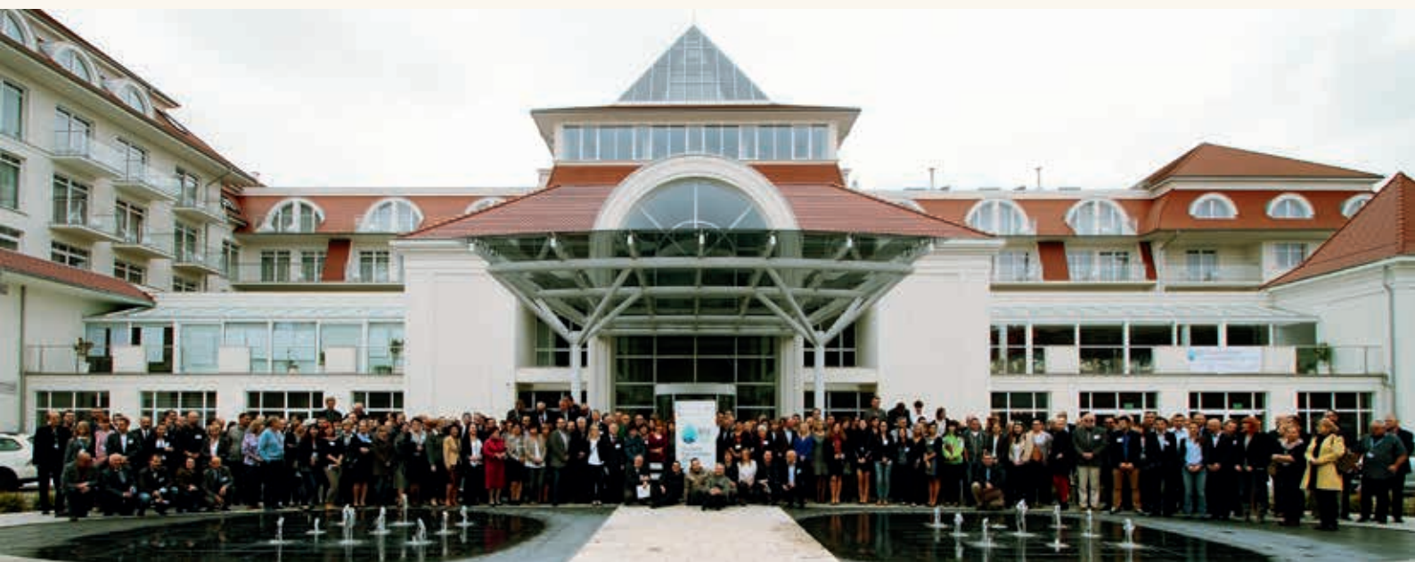
Uczestnicy XVII Sympozjum Współczesne problemy hydrogeologii przed hotelem Grand Lubicz w Ustce, gdzie odbywały się obrady

W dniach 20–23 października 2015 r. w Ustce odbyło się XVII Sympozjum Współczesne problemy hydrogeologii (WPH), które zostało zorganizowane przez Politechnikę Gdańską we współpracy z Państwowym Instytutem Geologicznym – Państwowym Instytutem Badawczym i Uniwersytetem Gdańskim. Partnerami tego przedsięwzięcia byli International Association of Hydrogeologists i Stowarzyszenie Hydrogeologów Polskich.