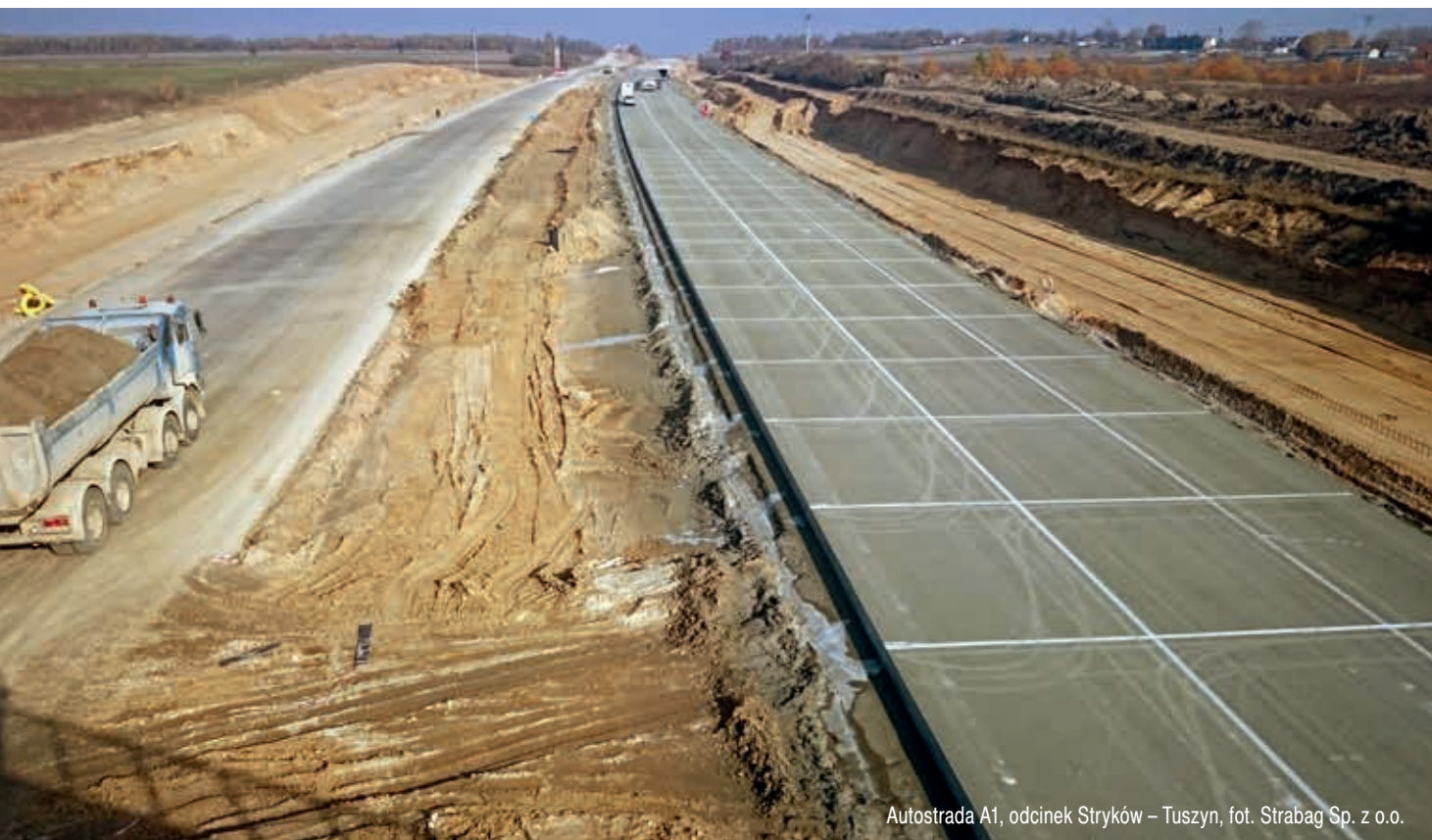
Autostrada A1, odcinek Stryków – Tuszyń, fot. Strabag Sp. z o.o.

Natomiast pod względem akcji przetargowej najbardziej aktywne są obecnie Pomorskie (blisko 150 km, głównie dzięki biegnącej przez cały region trasie S6), Mazowieckie (południowa obwodnica Warszawy i trasy dojazdowe do stolicy – S7, S8 oraz S17), a także Zachodniopomorskie (trasy S3 oraz S6). Te trzy województwa odpowiadają za ponad połowę długości tras będących teraz na etapie przetargu. Inne województwa ze znaczącą długością tras w przetargach to Lubelskie, Małopolskie i Wielkopolskie (wykres 1).