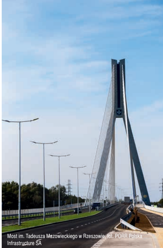
Most im. Tadeusza Mazowieckiego w Rzeszowie

Analizując wciąż mocno poszatkowaną sieć dróg ekspresowych i autostrad w Polsce, widać, że bardzo duże potrzeby inwestycyjne występują także w regionach słabiej rozwiniętych. W perspektywie długoterminowej prognozy są bardzo dobre dla budownictwa drogowego we wschodniej części kraju (Podlasie, Lubelszczyzna i Podkarpacie). Trasy w tych województwach odpowiadają za blisko połowę długości wszystkich planowanych w długim terminie dróg szybkiego ruchu. Jednak pełne sfinansowanie dróg w tych regionach nie będzie możliwe w bieżącej perspektywie unijnej, a termin ich realizacji jest bardzo odległy. Obecnie największe szanse na realizację na wschodzie kraju ma trasa S19 na odcinku Lublin – Rzeszów, dla którego w 2015 r. ogłoszono przetarg w trybie zaprojektuj i zbuduj.