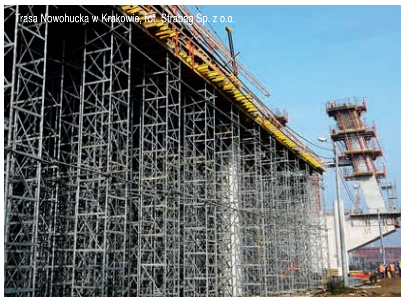
Trasa Nowohucka w Krakowie