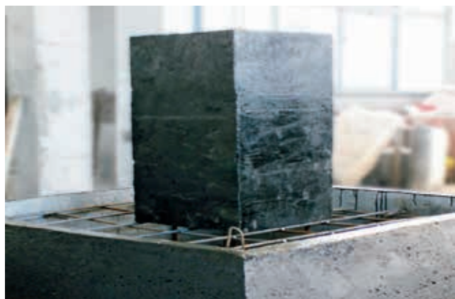
Ryc. 4. FHT produkcji WPŻ Elbud Gdańsk Sp. z o.o.

Konstruktorzy WPŻ Elbud Gdańsk Sp. z o.o. opracowali również kompatybilne ze skorupą FHT moduły budowy komina (ryc. 3 i 4). Występują one w dwóch wariantach wymiarowych: A – 60 x 60 x 20 cm, B – 80 x 120 x 20 cm, umożliwiając osiągnięcie w prosty i niezasochłonny sposób oczekiwanej wysokości komina.