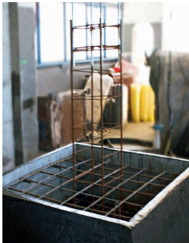
Ryc. 3. FHT produkcji i WPŻ Elbud Gdańsk Sp. z o.o.

Dzięki skorupowej konstrukcji (ryc. 1) fundamenty FHT pozwalają poczynić daleko idące oszczędności zarówno na etapie logistyki (transportu), jak również usprawnić proces ustawiania fundamentu w finalnej pozycji. Uzyskany dzięki powyższemu relatywnie krótki czas instalacji fundamentów FHT umożliwia dalszą redukcję roboczogodzin.