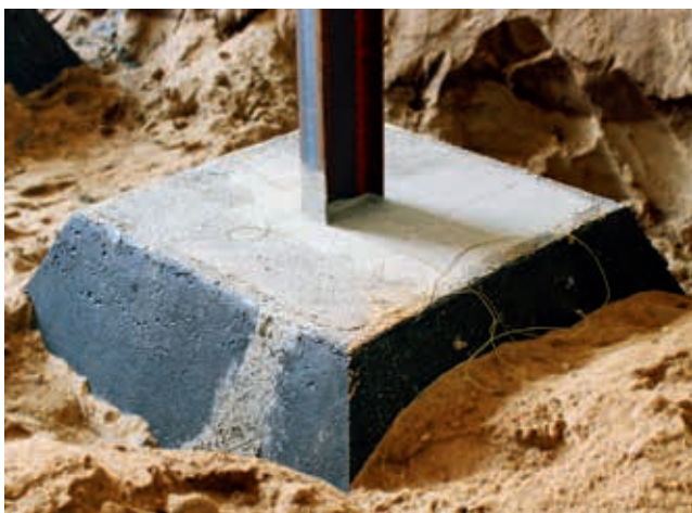
Ryc. 1. FHT produkcji WPŻ Elbud Gdańsk Sp. z o.o.

Realizowane aktualnie projekty inwestycyjne w branży budowlanej muszą sprostać nie tylko sukcesywnie rosnącym normom bezpieczeństwa, ale również efektywnie wpisywać się w rygorystyczne założenia finansowe i terminowe. Uwzględnienie tych aspektów powinno mieć miejsce zarówno na etapie projektowania, jak i realizacji danego obiektu.