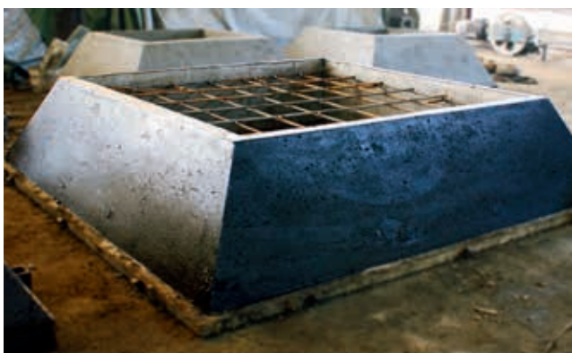
Ryc. 2. FHT produkcji WPŻ Elbud Gdańsk Sp. z o.o.

Fundamenty FHT dedykowane są pod budowę hal oraz innych obiektów, których konstrukcja nośna bazuje na strukturze stalowej lub żelbetowej.