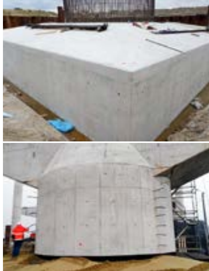
Ryc. 3, 4. Ubocznym efektem przyjętej technologii była wysoka jakość powierzchni betonu z cementem hutniczym

warstwami poziomymi. Warto nadmienić, że nie stwierdzono występowania osiadania plastycznego mieszanki, pomimo zlokalizowania przerwy na wysokości 3,0 m. Pośrednim dowodem podatności na zagęszczenie był uzyskany efekt jakości powierzchni, spełniający najostrzejsze wymagania stawiane betonom architektonicznym (ryc. 3, 4). Oczywiście, w przypadku fundamentów może być on dzisiaj obserwowany już wyłącznie na zdjęciach z realizacji, ale przełożył się w dużej mierze na doskonałą jakość powierzchni nadziemnych części podpór – słupów oraz rygli.