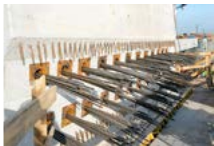
Ryc. 7. Widok strefy zakotwień kabli sprężających rygla podpory H, strona prawa

istotny wzrost wytrzymałości, przy czym różnice między betonem fundamentów (C30/37, cement hutniczy 345 kg/m 3 , gryś dolomitowy) i betonem podstaw / rygli (C50/60, 385 kg/m 3 , gryś granitowy) były już niewielkie. Przeprowadzone badania pozwalają jednak przypuszczać, że rzeczywistą długoterminową wytrzymałość betonu w masywie lepiej opisywać mogą wyniki po 28 dniach dla próbek pielęgnowanych zgodnie z normą (w wodzie). Dodatkowo na bieżąco kontrolowano wytrzymałość do wstępnego sprężania rygli. W tym przypadku wymagania były każdorazowo spełnione już dla próbek formowanych, a więc tym bardziej dla betonu stref zakotwień masywnych podpór (ryc. 7).