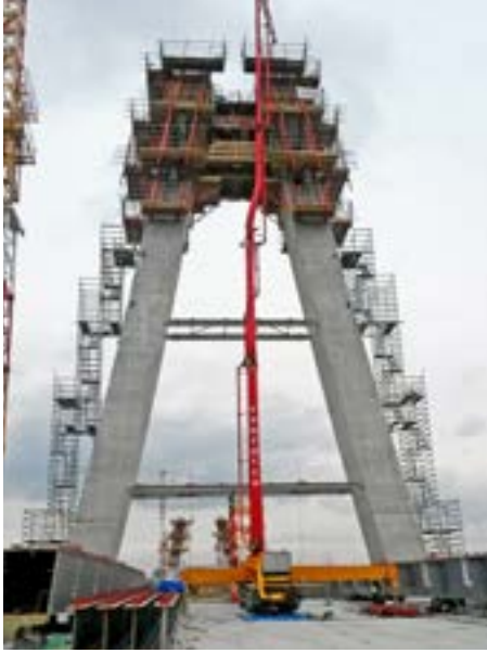
Ryc. 8. Formowanie ostatniego segmentu 50-metrowego pylonu

w roztworze w porach przy obniżeniu zawartości C_3A w cemencie. Podobnie jak w przypadku reakcji DEF, istotny wpływ [4, 5] mają również zawartość cementu, wartość w/c oraz zawartość SO_3 .