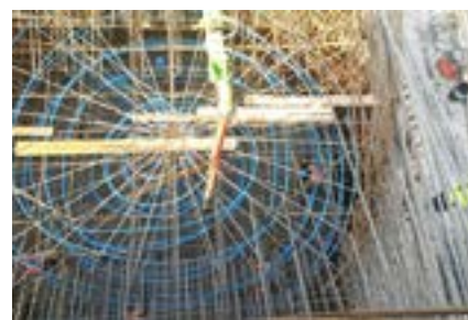
Ryc. 5, 6. Instalacja chłodzenia wewnętrznego słupów

i o temperaturze podwyższonej zaledwie o 2 °C, a więc w duchu zrównoważonego budownictwa.