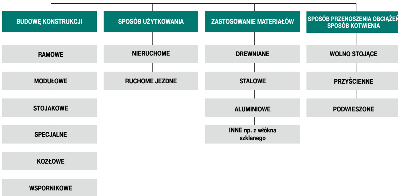
Ryc. 1. Podstawowe grupy rusztowań na rynku polskim [na podstawie www.rusztowania-izba.org.pl]

Podział rusztowań na rynku polskim ze względu na: