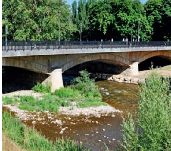
Kamienny most płytowy przez Arlanzón w Burgos (obiekt nr 52)