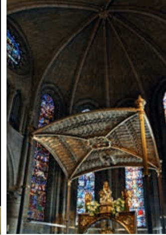
Wnętrze królewskiej kolegiaty przy dawnym klasztorze Augustianów w Roncesvalles

(obiekty nr 50 i 52) i żelbetowy (obiekt nr 51).