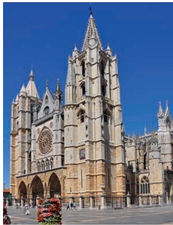
Katedra w León

Pałac powstawał z dużymi problemami. Najpierw dlatego, że Ministerstwo Sztuk Pięknych zgłosiło zastrzeżenia do projektu, na co artysta zareagował furją. Gdy prace ruszyły, Gaudí zdecydował, aby budynek wznosili znani mu inżynierowie i robotnicy z Katalonii, co jednak było kosztowne i po utarczkach z inwestorem doprowadziło do wycofania ekipy z budowy. W trakcie wojny domowej pałac pełnił rolę więzienia falangistów, ostatecznie został oddany do użytku w latach 60. XX w. Największy kunszt prezentuje znajdująca się na piętrze kaplica z cudownym festiwalem światła dzięki