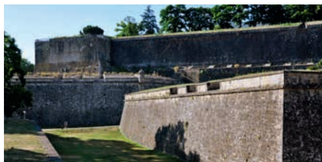
Ufortyfikowane mury miejskie (cytadela) przez Argę w Pampelunie