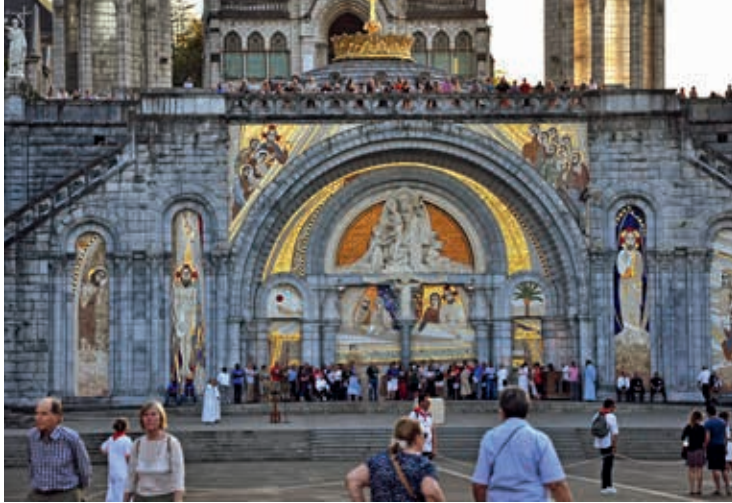
Portal bazyliki Różańcowej w Lourdes