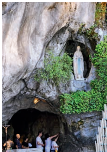
Grotta Massabielska w Lourdes

Podczas procesji z oddali oglądaliśmy główne elementy sanktuarium: Grotę