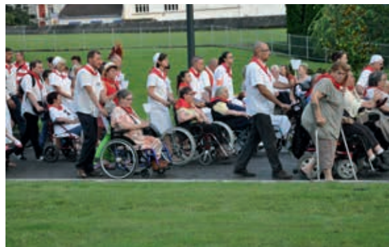
Wieczorna procesja różańcowa w Lourdes

Massabielską , kościół górny – bazylikę Niepokalanego Poczęcia Najświętszej Marii Panny (fr. Basilique de l'Immaculée-Conception , 1871) i kościół dolny – bazylikę Różańcową (fr. Basilique Notre-Dame-du-Rosaire ), która może pomieścić 2,5 tys. ludzi, a także zamek na stromym skalnym urwisku, strzegący wejścia do dolin i przełęczy Pirenejów Środkowych. Pełni wrażeń i zadumy wróciliśmy na noc do naszego hotelu położonego w centrum Lourdes.