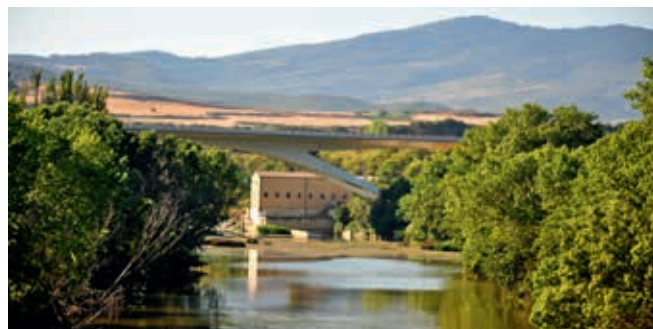
Betonowy most ramowy przez Argę w Puente la Reina (obiekt nr 63)