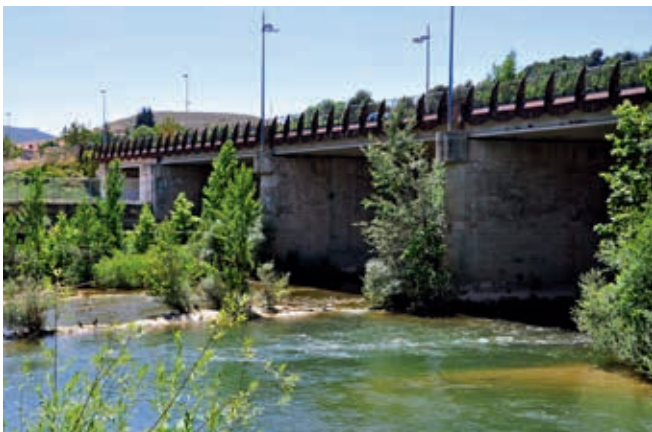
Prefabrykowany most belkowy w Miranda del Ebro (obiekt nr 57)