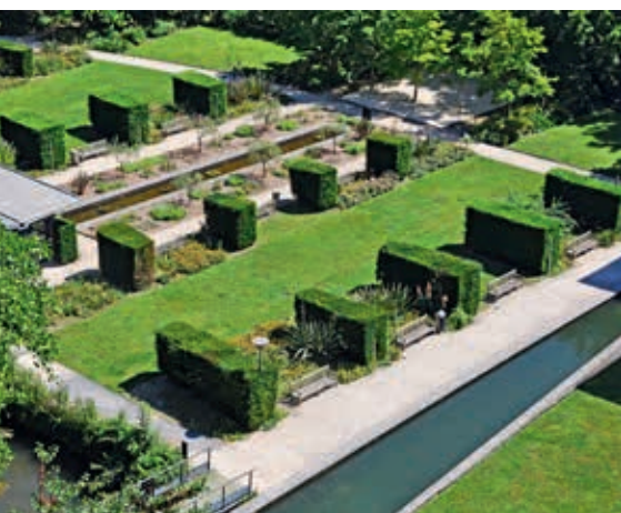
Ogrody w Pau widziane z Bulwaru Pirenejskiego