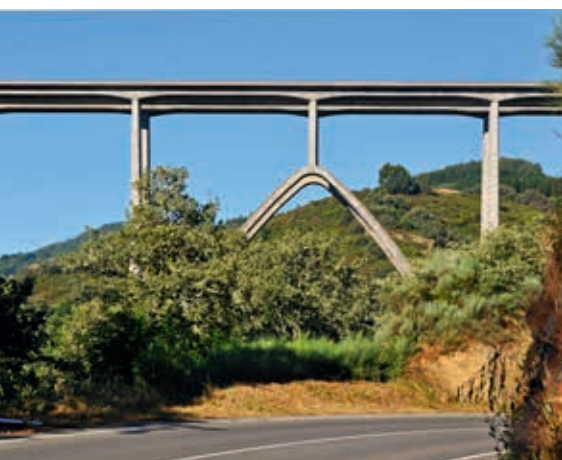
Viaducto de Naron (obiekt nr 47)

W kolejnym odcinku relacji z wyprawy mostowej do północnej Hiszpanii zbliżamy się do Pirenejów, w których znaleźliśmy się 18. dnia wyprawy. Po stronie francuskiej zwiedziliśmy Saint-Jean-Pied-de-Port i Pau, ale największe przeżycia towarzyszyły nam podczas pobytu w Lourdes.