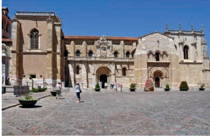
Bazylika San Isidoro w León

miejsu ok. 1300 r. Obok świątyni jest kilka pallozas – okrągłych, krytych strzechą kamiennych chat o celtyckim układzie, zwykle wykorzystywanych przez pielgrzymów jako schronienie. Ponadto znajdują się tu również średniowieczne, zbudowane z kamienia hotele dla pielgrzymów.