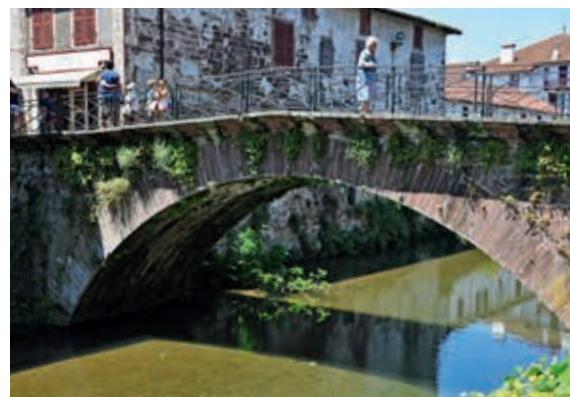
Jednoprzęsłowy, łukowy most kamienny przez Nivę w Saint-Jean-Pied-de-Port (obiekt nr 67)