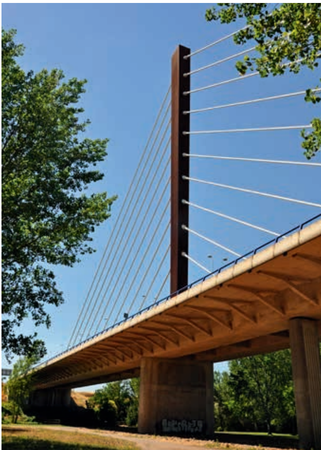
Podwieszony most betonowy w Logroño (obiekt nr 58)