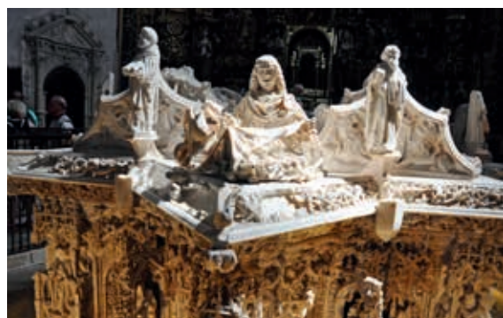
Alabastrowy grobowiec króla Jana II Kastylijskiego w kościele przy klasztorze Kartuzów w Burgos