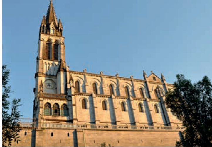
Bazylika górna w Lourdes

Tolosa (1212); ten pogromca Maurów mierzył ponoć ponad 2,5 m wzrostu.