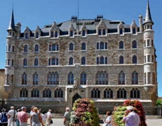
Casa Botines w León