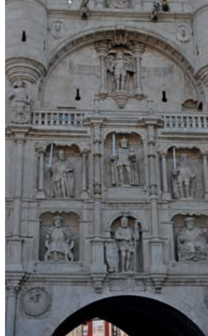
Arco de Santa María w Burgos

Niskie kolumny dzielą dwunawowe wnętrze, którego sklepienia i łuki tarczowe pokrywają wspaniałe romańskie freski (1181). Panoramiczne kompozycje ukazują m.in. Zwiastowanie pasterzom i Rzeź niewiniątek , na gurtach namalowano Prace miesięcy (kalendarz przedstawiający krajobrazy we wszystkich 12 miesiącach roku) oraz znaki zodiaku. Z Panteonu przechodzi się do krużganków, skarbcza (zawierającego m.in.