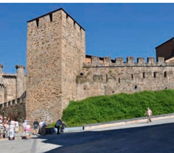
Zamek templariuszy w Ponferradzie

Na wzgórzach wschodniej Galicji, blisko granicy z prowincją León, leży jedna z najosobliwszych wiosek na drodze do Santiago de Compostela. Położona na wysokości 1330 m n.p.m. jest pierwszą galisyjską miejscowością na francuskiej drodze św. Jakuba. Malownicza osada zachowała swój średniowieczny charakter. Romański kościół z XI w. zasłynął z cudu eucharystycznego zamiany opłatka i wina w ciało i krew, który wydarzył się w tym