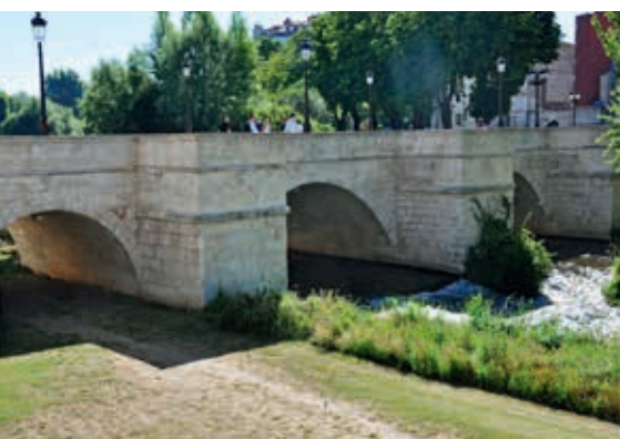
Kamienny most łukowy San Pablo przez Arlanzón w Burgos (obiekt nr 50)

licznym trzyczęściowym oknom, wyposażonym w witraże.