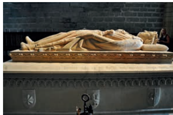
Grobowiec fundatora królewskiej kolegiaty w Roncesvalles, Sancha VII Mocnego

Puente la Reina to miejscowość położona 25 km na zachód od Pampeluny, gdzie łączą się dwa szlaki drogi św. Jakuba – Camino Francés i Camino