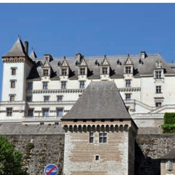
Château de Pau przy Bulwarze Pirenejskiego

Aragonés. Znajduje się tu – przez rzekę Arge – pochodzący z XI wieku romański Puente la Reina , od którego pochodzi nazwa miejscowości (obiekt nr 61), zbudowany na rozkaz królewski dla pielgrzymów. Jest to kamienny, łukowy most siedmioprzęsłowy o długości 110 m, z załamaniem niwelety w środku długości i kamiennymi, pełnymi balustradami. Widok tego mostu figuruje na banknocie o nominale 20 euro. Szlak pielgrzymkowy przebiega przez centrum miasta, m.in. obok kościoła św. Jakuba, który przy wejściu ma złożoną figurę świętego jako pielgrzyma.