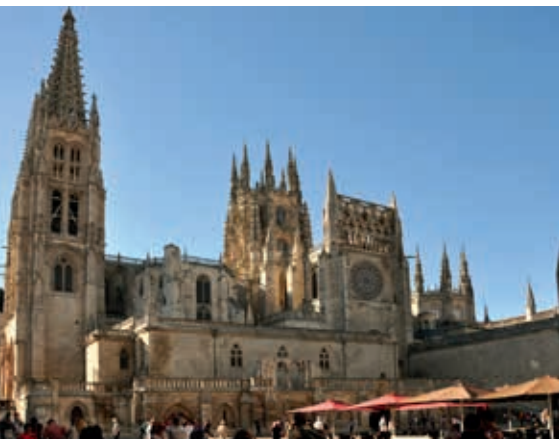
Katedra w Burgos