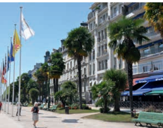
Bulwar Pirenejski w Pau