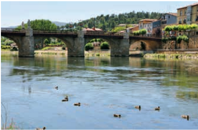
Kamienny most sklepiony Karola III w Miranda del Ebro (obiekt nr 56)