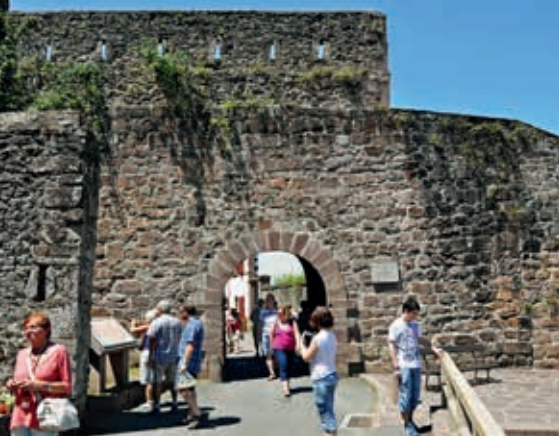
Porte Saint-Jacques w Saint-Jean-Pied-de-Port