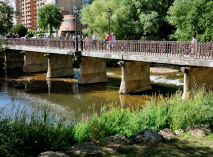
Żelbetowy most płytowy przez Arlanzón w Burgos (obiekt nr 51)