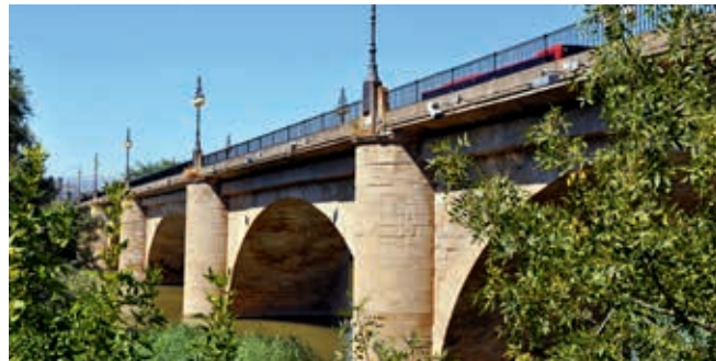
Kamienny most łukowy Puente Pedro przez Ebro w Logroño (obiekt nr 59)