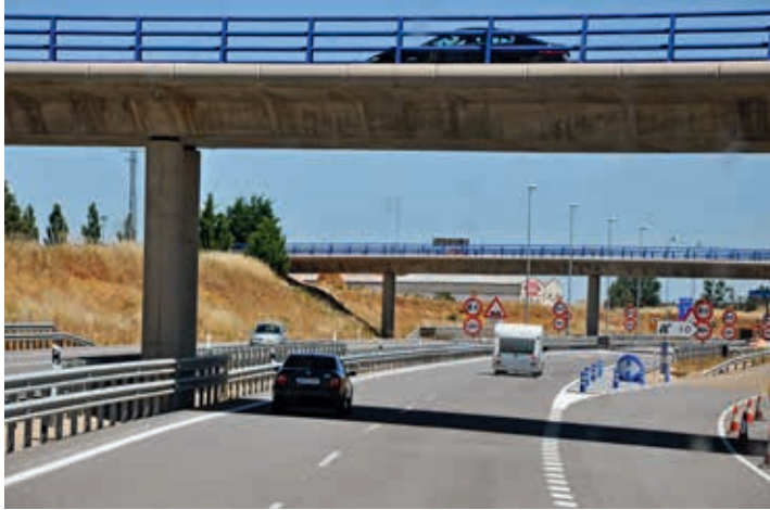
Wiadukty nad autostradą do León