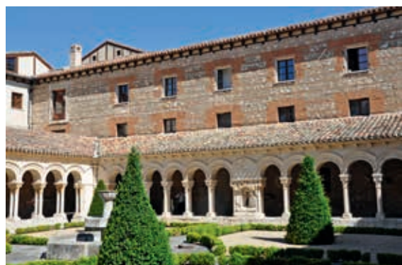
Wirydarz w Real Monasterio de las Huelgas w Burgos

Odwiedziliśmy położony ok. 1,5 km na zachód od katedry cysterski klasztor żeński Las Huelgas (Monasterio de Santa María la Real de Las Huelgas), w którym znajduje się panteon królów kastylijskich. Klasztor ten został ufundowany w 1187 r. dla bardzo bogatych mniszek z najlepszych rodów. Obejrzeliliśmy gotycki krużganek San Fernando, ozdobiony arabskimi rysunkami paw i gwiazd, kaplicę św. Jakuba oraz Museo de Ricas Telas del Monasterio de Las