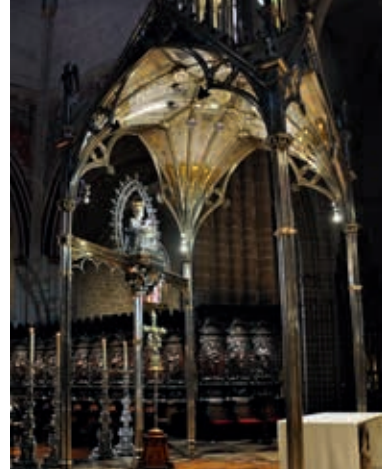
Wnętrze katedry w Pampelunie