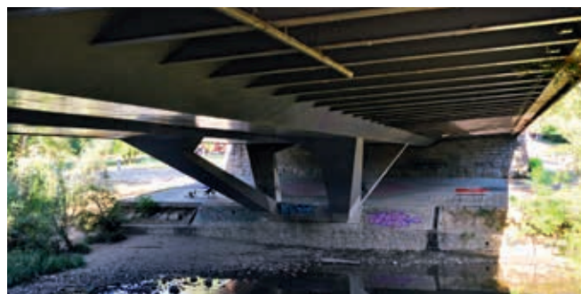
Betonowy most ramowy przez Argę w Pampelunie (obiekt nr 64)