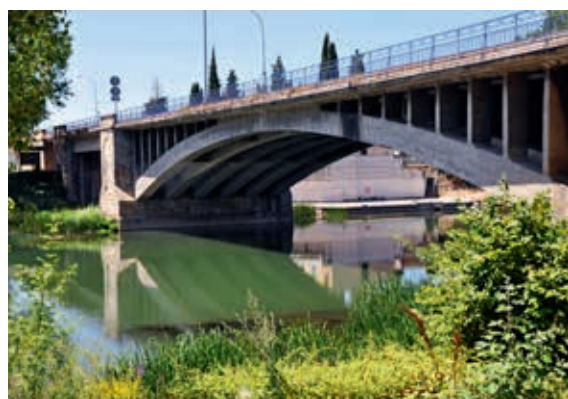
Żelbetowy most łukowy w Miranda del Ebro (obiekt nr 54)

Huelgas, zawierające unikatową kolekcję średniowiecznych tkanin.