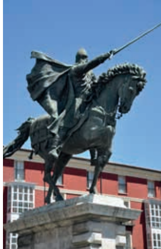
Pomnik Cyda Campeadora w Burgos