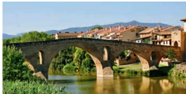
Łukowy most kamienny Puente la Reina przez Argę w Puente la Reina (obiekt nr 61)