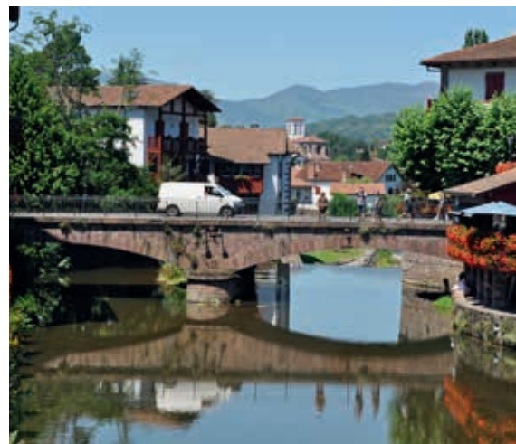
Dwuprzęsłowy, łukowy most kamienny przez Nivę w Saint-Jean-Pied-de-Port (obiekt nr 68)