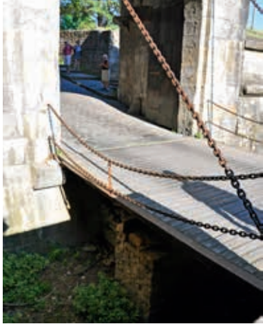
Most zwodzony przed bramą Starego Miasta w Pampelunie (obiekt nr 66)