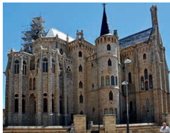
Pałac biskupi w Astordze