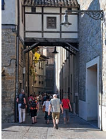
Wejście do Starego Miasta w Pampelunie