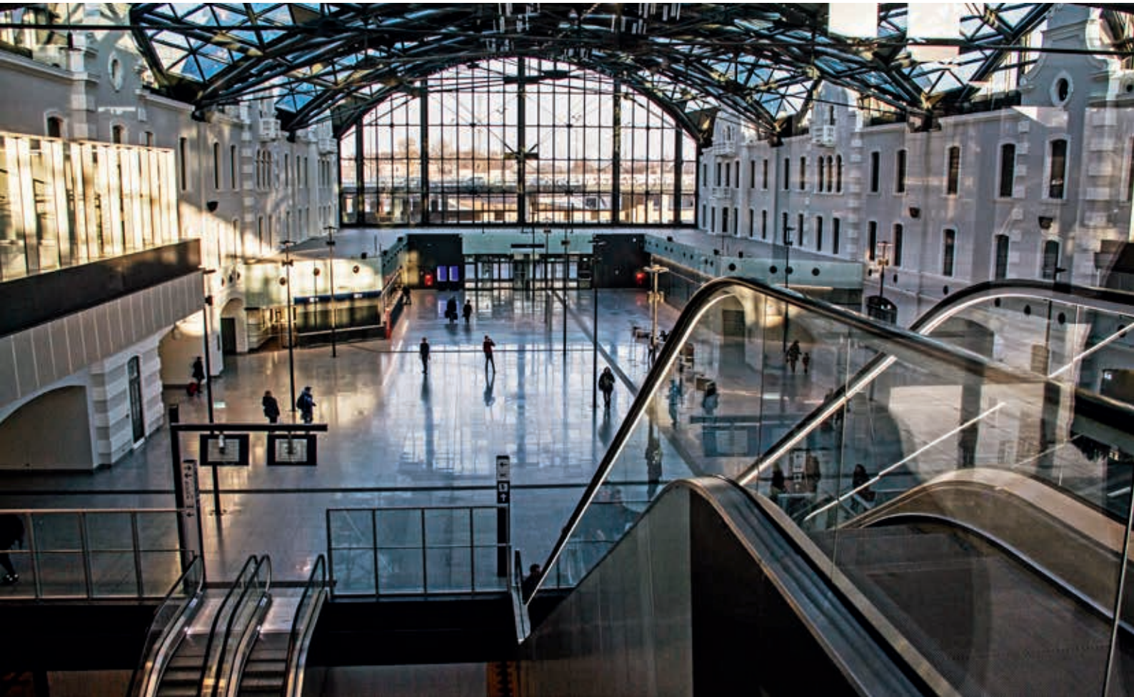
Dworzec kolejowy Łódź Fabryczna

i znaczenie kolei dla gospodarki. Ogromnie pozytywny efekt przyniosą także projekty planowane do realizacji ze środków Regionalnych Programów Operacyjnych (RPO). Przypomnę, że w KPK w ramach RPO zapisano (na liście podstawowej) 51 projektów w 16 województwach na kwotę 4,6 mld zł. Przykładowo, w województwie pomorskim – notabene to największy beneficjent programu, bo wartość projektów wynosi ponad 605 mln zł – zrewitalizujemy ponad 100 km linii kolejowych. Podobnie w województwach wielkopolskim i podkarpackim.