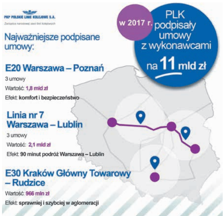
Najważniejsze podpisane umowy przez PLK

Bezpieczeństwo to priorytet w działalności PLK. W celu zwiększenia jego poziomu cały czas podejmujemy działania w trzech obszarach: inwestycyjnym,