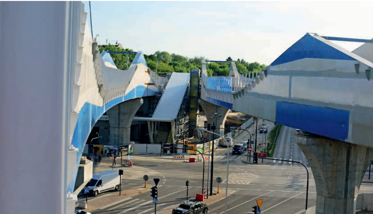
Łącznica kolejowa Kraków Zabłocie – Kraków Krzemionki

Olsztyn. Szybciej i wygodniej można podróżować do Łodzi, Białegostoku, a w 2018 r. dzięki modernizacji linii obwodowej w Warszawie pociąg stanie się wygodną alternatywą dla samochodu. Kolejowe inwestycje realizowane w ramach KPK połączą regiony i województwa. Np. na trasie Olsztyn – Białystok dzięki modernizacji i elektryfikacji trasy z Ełku do Korsz oraz budowie drugiego toru na trasie Białystok – Ełk zwiększymy prędkości do 120–160 km/h i pojedziemy z Olsztyna do Białegostoku o ok. 1 godz. krócej, z obecnych ok. 3 godz. 40 min do ok. 2 godz. i 40 min. Wygodne perony na stacjach i przystankach, wyposażone w udogodnienia dla osób niepełnosprawnych, zwiększą komfort podróży pasażerów. Poprawi się przepustowość linii, co stworzy nowe możliwości dla przewozów regionalnych i dalekobieżnych. Niezmiernie mnie cieszy, że pasażerowie wracają na kolej, co potwierdziły badania Urzędu Transportu Kolejowego. W 2016 r. sprzedano 292,5 mln biletów kolejowych. To najlepszy wynik od lat.