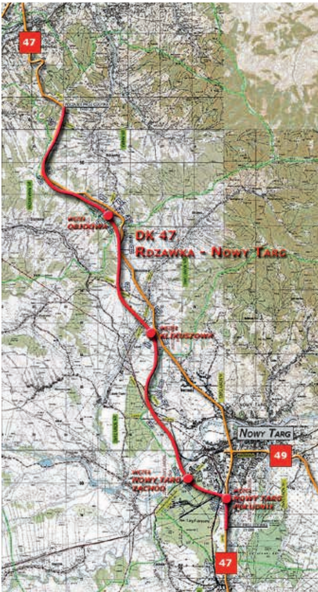
Droga krajowa nr 47, odcinek Rdzawka – Nowy Targ

części Zabierzowa z ruchu pojazdów. Dzięki inwestycji zmniejszy się natężenie ruchu w centrum miejscowości, ograniczeniu ulegnie poziom zanieczyszczenia i hałasu na obszarze intensywnie zurbanizowanym, poprawią się warunki bezpieczeństwa na drogach.