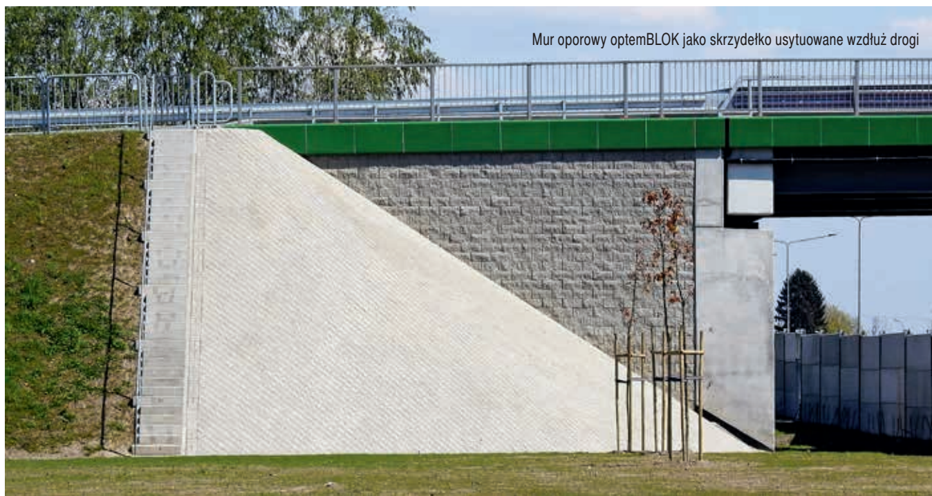
Mur oporowy optemBLOK jako skrzydełko usytuowane wzdłuż drogi

Jednym z najważniejszych i najbardziej powszechnych zastosowań murów oporowych są tzw. skrzydełka, które w przypadku budowy odcinka S8 Opacz – Paszków były konstruowane w formie murów usytuowanych wzdłuż drogi, równoległe do osi drogi oraz w formie skrzydełek ukośnych. Takie zastosowanie murów oporowych umożliwia znaczne ograniczenie powierzchni i długości skrzydełek oraz pośrednio wpływa na zmniejszenie ilości obrukowania stożków. System optemBLOK pozwala nie tylko na ograniczenie kosztów wykonania takiej konstrukcji, ale w znaczący sposób wpływa również na czas wykonywania danej ściany. W miejscach występowania płyty przejściowej należy miejscowo dogęścić rozstaw geosyntetyków, a dodatkowym usztywnieniem takiego muru jest zabetonowanie kanału wewnątrz bloczków do spodu płyty przejściowej. Takie wypełnienie betonem tworzy sztywny wieniec, który jeszcze bardziej poprawia stateczność muru w newralgicznym miejscu. Jest to szczególnie ważne w murach wzdłuż drogi,