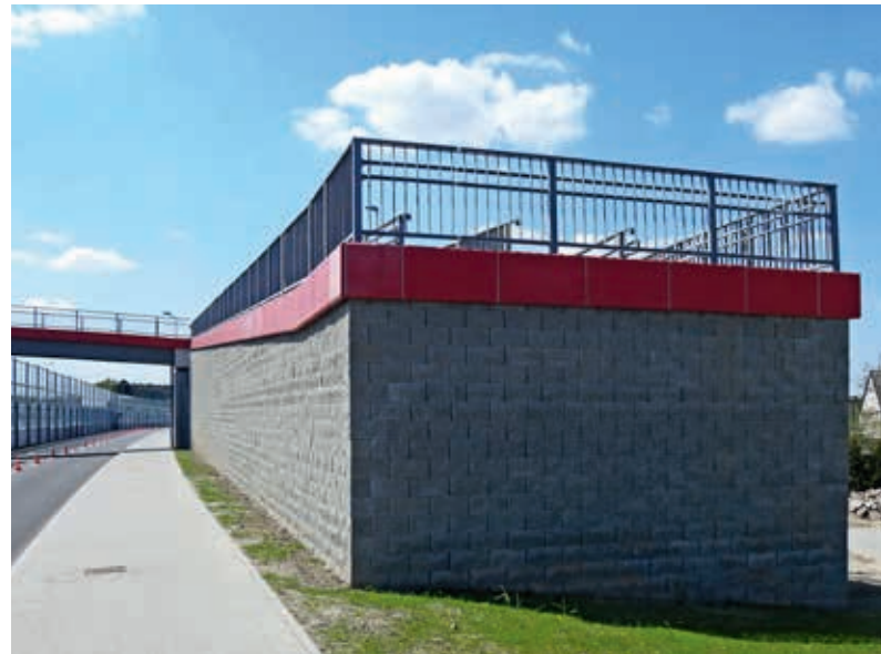
Mury oporowe z elementów drobnowymiarowych znajdują zastosowanie również w przypadku kładek

Z uwagi na postępujący proces urbanizacji istnieje coraz większy problem z wygospodarowaniem odpowiednio dużego miejsca pod inwestycję. W wielu przypadkach budowa muru oporowego zwalnia inwestora z konieczności wykupywania dodatkowego terenu lub wręcz umożliwia jego lepsze zagospodarowanie dzięki zaoszczędzonej przestrzeni. Przywołując wymienione wyżej, najważniejsze zalety systemu optemBLOK, można by pokusić się o stwierdzenie, że obecnie jest to jedno z najkorzystniejszych rozwiązań konstruowania murów opo-