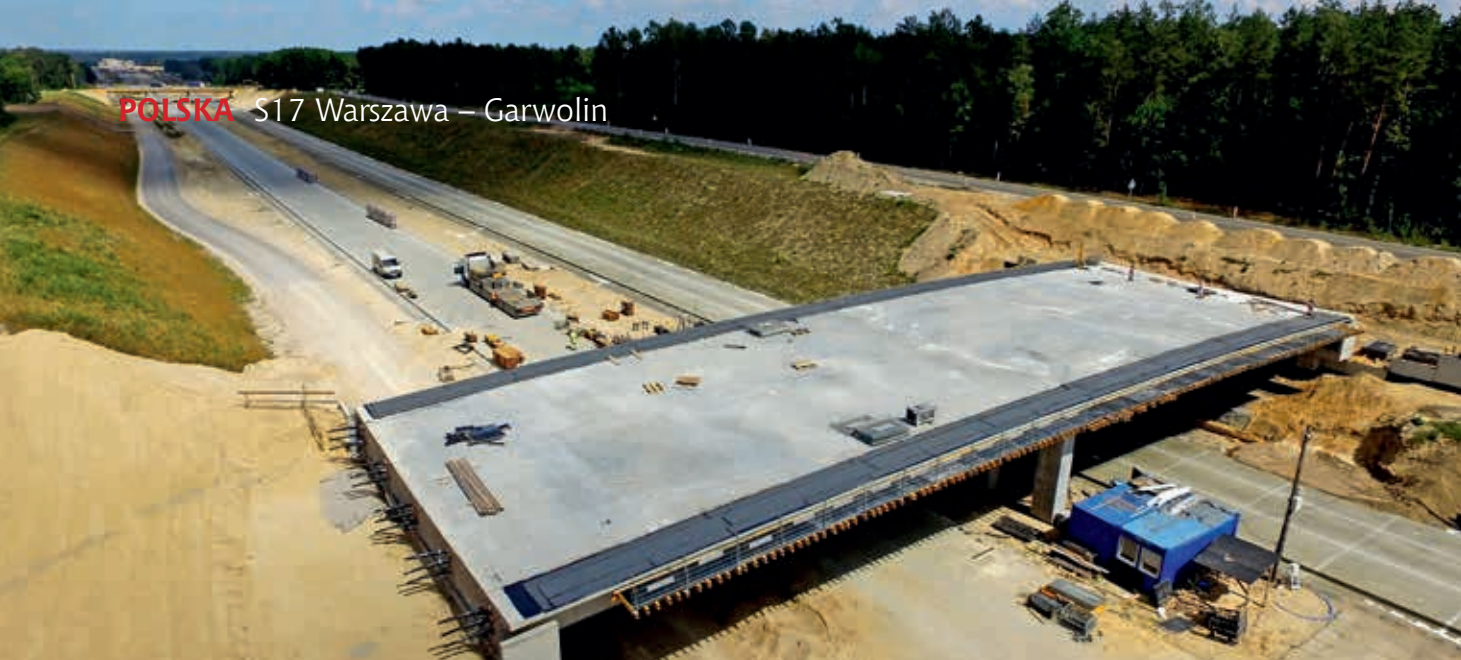
Odcinek Gończyce – granica województw mazowieckiego i lubelskiego. Budowa przejścia dla zwierząt górą – PZG23 w km 54 + 450, fot. Euroconsult