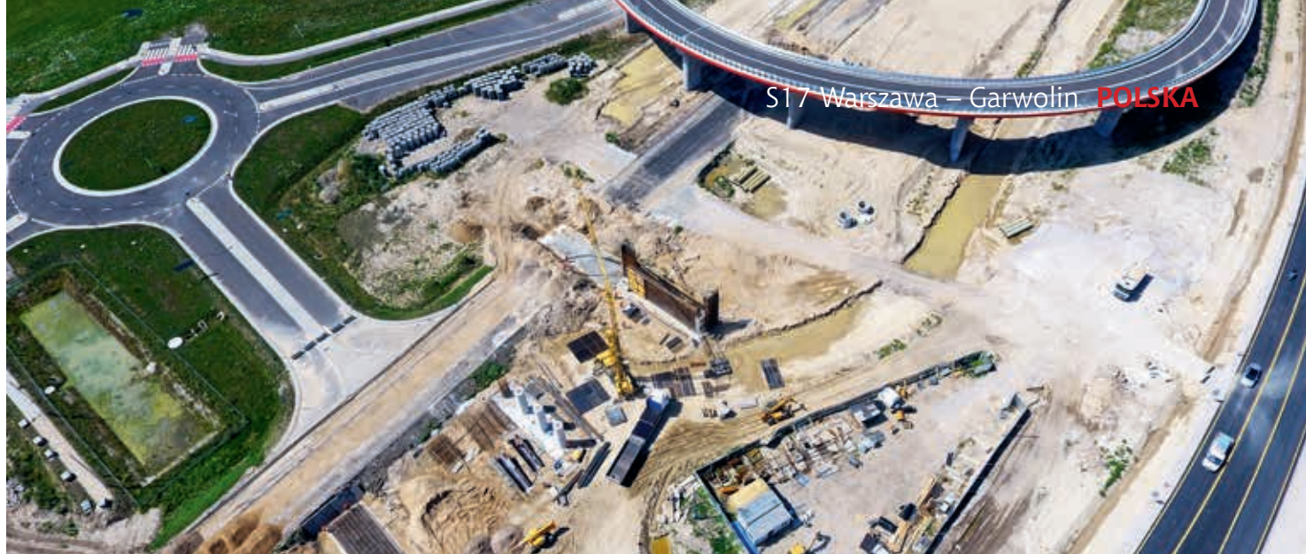
Odcinek Lubelska – Kołbiel, widok na bajpas DD02 oraz frezowanie DK17 w miejscowości Góraszka, fot. J. Grzejszczak

Inwestycja obejmuje budowę obwodnicy wraz z węzłem drogowym Kołbiel na przecięciu projektowanej obwodnicy drogi S17 z projektowaną obwodnicą w ciągu drogi nr 50. Przebudowane zostaną także istniejące drogi kolidujące z planowaną ekspresówką, powstaną nowe obiekty inżynierskie, miejsca obsługi podróżnych, urządzenia służące ochronie środowiska oraz zdrowia mieszkańców (urządzenia podczyszczające ścieki przed odprowadzeniem do odbiornika, przejścia dla dużych i małych zwierząt oraz przepusty dla płazów, chodniki i ścieżki rowerowe).