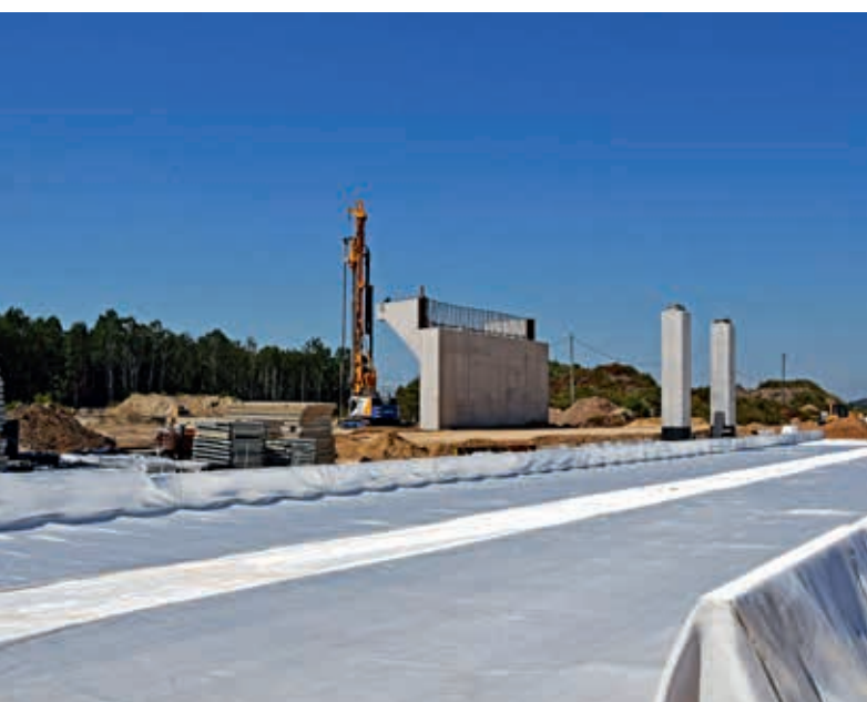
Kolbiel – Garwolin. Wykonanie geomateraca w km 38 + 180 - 38 + 250