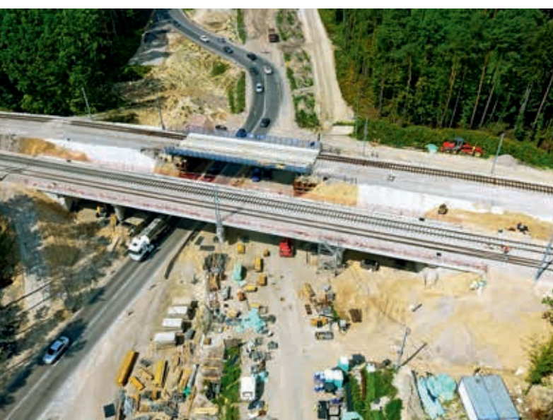
Roboty torowe na obiekcie WK-1 w km 39 + 417, odcinek Kolbiel – Garwolin, fot. J. Grzejszczak