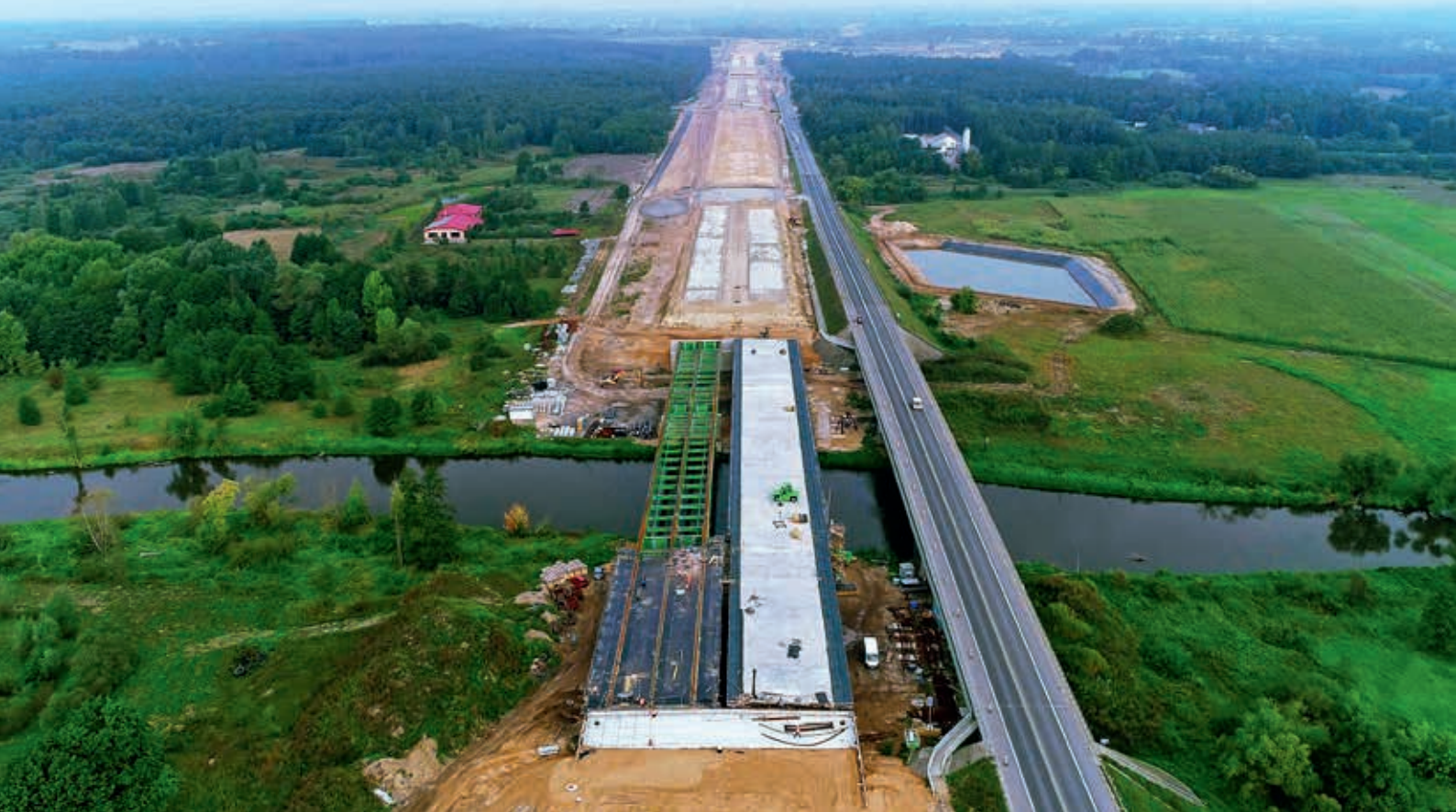
MS-4 na odcinku granica województw mazowieckiego i lubelskiego – węzeł Skrudki