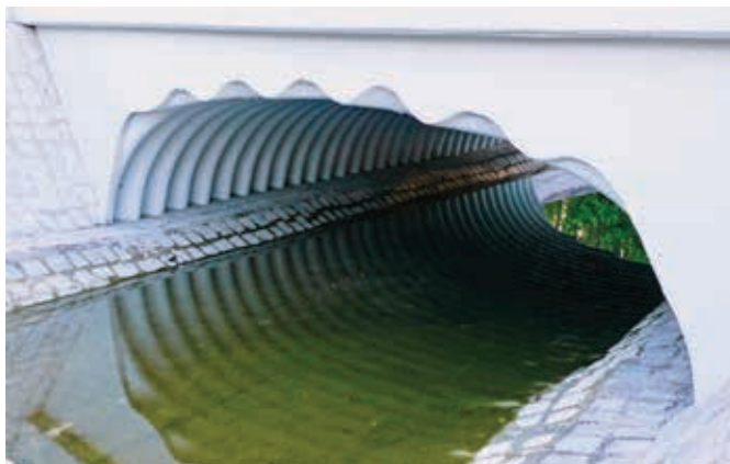
Ryc. 3. Przykład wykończenia części wlotowej obiektu w postaci żelbetowej ściany czołowej

ta polega na okryciu powierzchni skarpy darnią w postaci prostokątnych płatów lub pasów. Inną biologiczną metodą wzmocniania jest hydrosiew . Należy on do najszybszych metod wzmocniania skarp przez ukorzenie się roślin. Ta od wielu lat stosowana metoda polega na hydromechanicznym (wodnym) pokrywaniu skarp preparatem będącym mieszaniną wody, nasion roślin, hydromulczu celulozowego (włókien celulozowych), nawozów, a także substancji zabezpieczających przed erozją wodną i wietrzną oraz nadmiernym wysychaniem [12].