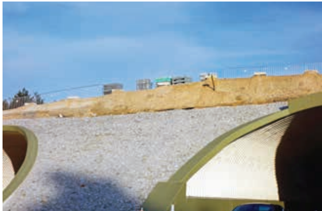
Ryc. 7. Przykład wykonywania umocnienia skarpy górnego przejścia dla dużych zwierząt z wykorzystaniem kostki kamiennej