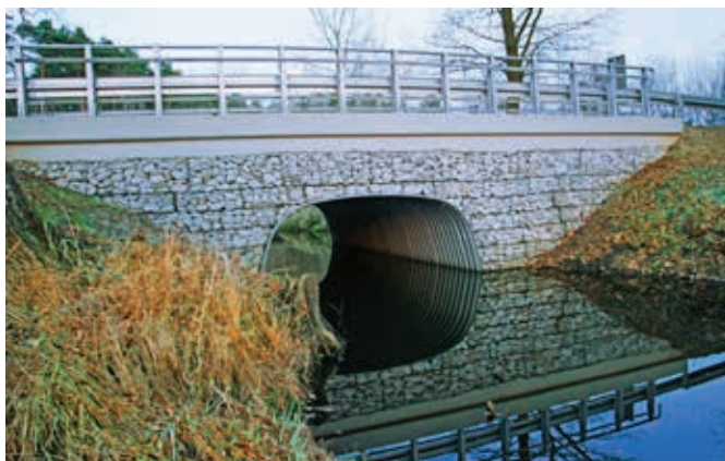
Ryc. 2. Przykład zastosowania ściany czołowej przepustu z gabionów. Widoczny wzmocniający gzyms żelbetowy