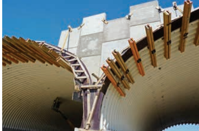
Ryc. 6. Przykład wykonywania umocnienia skarp ekomostu w technologii gruntu zbrojonego z wykorzystaniem lekkich ścian osłonowych

Przy wykonywaniu prac wykończeniowych dotyczących umocnień należy mieć na uwadze, że na obszarach migracji płazów nie powinno się używać pionowych umocnień (np. płotków faszynowych), gdyż utrudniają one przekraczanie cieku przez większość gatunków tych zwierząt.