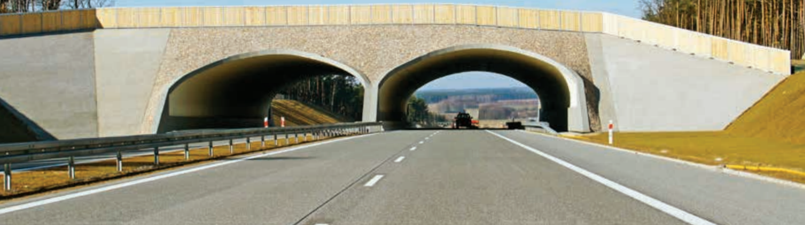
Ryc. 12. Przykład wykończonego przejścia dla dużych zwierząt wraz z niezbędnym wyposażeniem technicznym i utrzymaniowym

autorów, w dalszym ciągu intensywnie rozwijana. Wynika to z faktu budowy wielu obiektów o tej konstrukcji, a także ciągłego doskonalenia technologii oraz podnoszenia standardów wykonawstwa tego typu robót. Cieszy sytuacja, że wiele światowych sprawdzonych rozwiązań z tego zakresu stosowanych jest obecnie z powodzeniem również w naszej krajowej praktyce inżynierskiej. Część tych rozwiązań w postaci nowoczesnych technologii i materiałów wdrażana jest także w zakresie wykonawstwa konstrukcji przepustów i ekomostów. Dotyczy to rozwiązań konstrukcyjnych elementów, w tym prefabrykowanych, systemów połączeń, jak również jakości robót wykończeniowych. Z pewnością przyczynia się to do zwiększenia trwałości opisywanych obiektów infrastruktury komunikacyjnej.