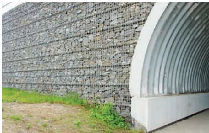
Ryc. 1. Przykład konstrukcji z gruntu zbrojonego z lekką ścianą osłonową w postaci siatki stalowej z wypełnieniem kamiennym

Gdy skarpy znajdują się w obszarze dostępnym dla zwierząt (w przypadku przepustów o funkcji zespolonej), należy zapewnić zwierzętom bezpieczne poruszanie się po ich powierzchni. W tym celu do wzmocnienia skarp należy wykorzystywać w pierwszej kolejności metody biologiczne oraz geosyntetyki z docelowym wprowadzeniem pokrywy roślinnej. Należy pamiętać, aby w obrębie przejścia umocnienie odpowiednio wykończyć. Nie mogą występować w nim elementy o ostrych krawędziach (np. gabiony), które mogłyby zranić zwierzęta. Powinno się również unikać betonowania powierzchni skarp. Jedną z najprostszych metod umacniania skarp, zapewniających odpowiednią stateczność i ochronę przed obsunięciem się skarpy o niedużym nachyleniu, jest darniowanie . Metoda