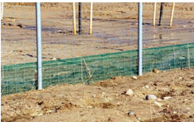
Ryc. 10. Przykład wykonanego ogrodzenia w obrębie najścia przejścia górnego dla dużych zwierząt. W dolnej części widoczne jest dodatkowe ogrodzenie ochronne dla małych ssaków i herpetofauny