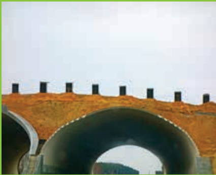
Tab. 1. Poszczególne etapy wykonywania systemu ogrodzenia ochronnego na przykładzie ekomostu o konstrukcji podatnej z blach falistych