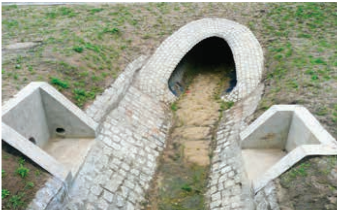
Ryc. 5. Przykład dna cieku i skarp umocnionych kostką granitową

właściwości mechaniczne rodzimego gruntu nie mogą zapewnić wymaganej wartości nośności i stabilności, jest zastosowanie geosyntetyków [2]. Geosyntetyki przy wzmacnianiu oskarpowania mogą być wykorzystywane jako zbrojenie gruntu przy budowie stromych skarp pokrytych roślinnością lub jako ochrona powierzchni przed erozją. W tym celu stosowane mogą być materiały geosyntetyczne w postaci geokomórek wypełnionych gruntem lub lekkie geosiatki, często rozkładane na powierzchni skarp, aby zapewnić tymczasowe oparcie dla roślinności. W ostatnich latach coraz częściej stosowane są z dobrym skutkiem geokraty, które wypełnia się różnorodnym materiałem w zależności od nachylenia skarp. Porastająca je z czasem intensywna roślinność powoduje, że sprawdzają się one z powodzeniem również przy przejściach dla zwierząt.