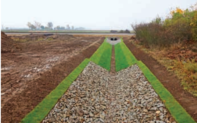
Ryc. 4. Przykład wykonania umocnienia dna cieku i skarp z wykorzystaniem narzutu kamiennego i darniowania