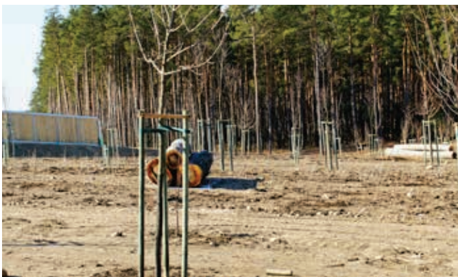
Ryc. 11. Przykład zagospodarowanej nawierzchni w obrębie najścia przejścia górnego dla dużych zwierząt bezpośrednio po jej wykonaniu. Widoczne elementy wyposażenia nawierzchni w postaci nasadzeń oraz stosów pni umożliwiających schronienie się mniejszych zwierząt

środowisko jako opisane wyposażenie powinno się wykorzystywać elementy prefabrykowane lub częściowo prefabrykowane.