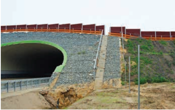
Ryc. 8. Przykład zastosowania schodów skarpowych do celów inspekcyjnych w przypadku górnego przejścia dla dużych zwierząt