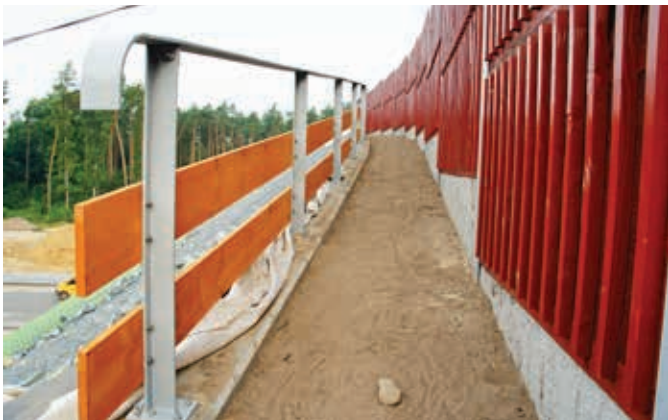
Ryc. 9. Przykład wykonanego chodnika inspekcyjnego w celach utrzymaniowych górnego przejścia dla dużych zwierząt