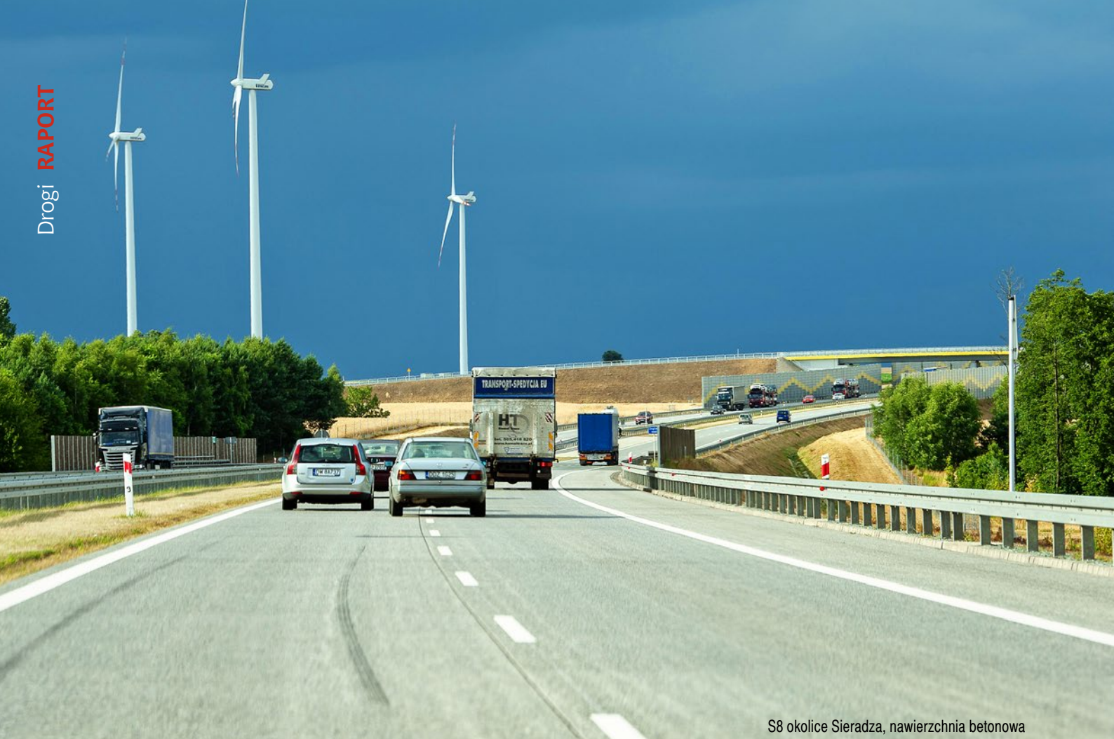
S8 okolice Sieradza, nawierzchnia betonowa