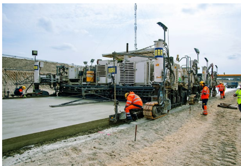
Układanie nawierzchni betonowej na S17 od granicy województw do węzła Skrudki