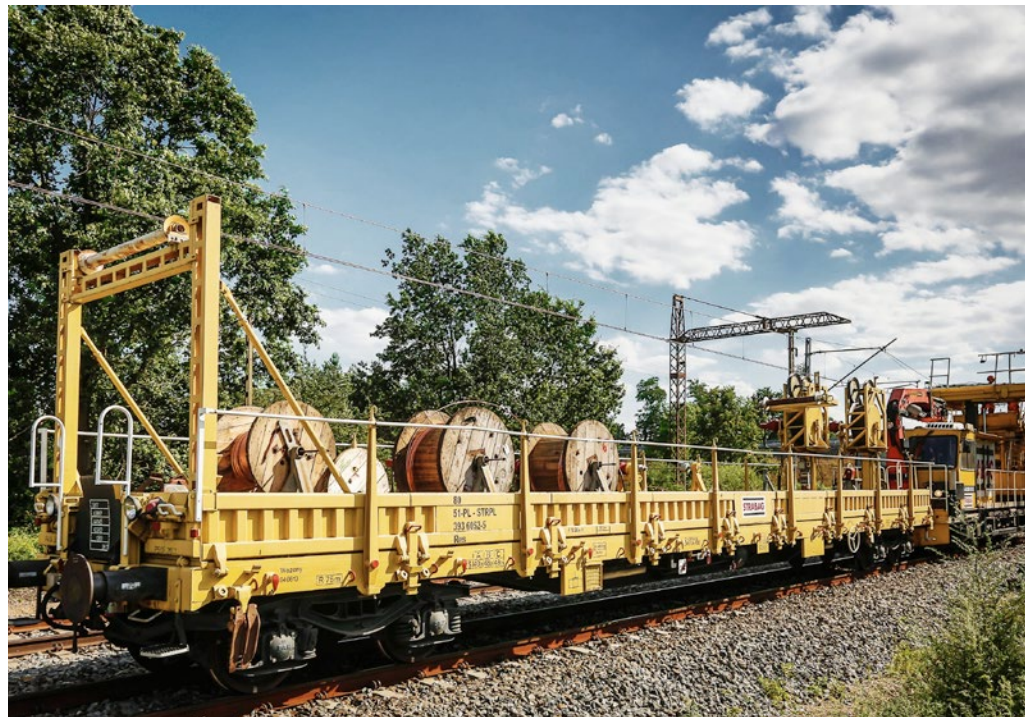
Pociąg sieciowy UCS oraz wagony do wywieszenia przewodów kolejowej sieci trakcyjnej

sieciowych. Naszym celem poza wykonywaniem robót trakcyjnych na budowach STRABAG jest nawiązywanie współpracy z innymi generalnymi wykonawcami.