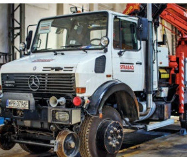
Pojazd dwudrogowy Mercedes Unimog do sieci trakcyjnej