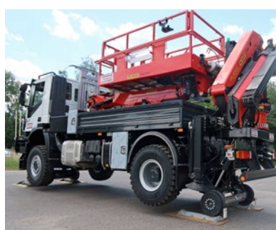
Pojazd dwudrogowy Iveco Trakker do sieci trakcyjnej