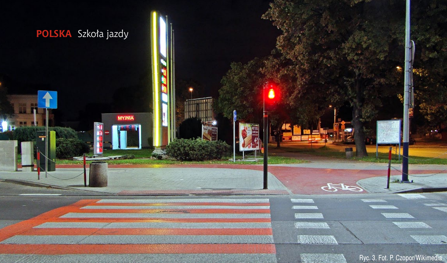
Ryc. 3.

► Ustąpienie pierwszeństwa pieszemu oznacza powstrzymanie się przez kierującego od jazdy, jeżeli zmusiłaby ona pieszego do zatrzymania się albo zwolnienia lub przyspieszenia kroku.