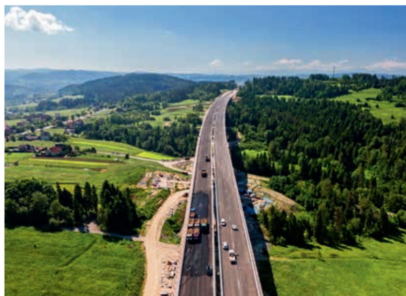
S7 Skomielna Biała – Rabka-Zdrój

Na północy kraju, w województwie zachodniopomorskim, kierowcy mogą już korzystać z całego ciągu drogi S6 pomiędzy Goleniowem a Koszalinem o długości ok. 130 km.