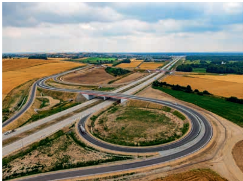
Autostrada A1, obwodnica Częstochowy

W 2019 r. GDDKiA oddała do ruchu 460 km dróg, w tym m.in.: A1 Częstochowa Północ – Częstochowa Błachownia, A1 Częstochowa Błachownia – Częstochowa Południe, A1 Częstochowa Południe – Woźniki, A1 Woźniki – Pyrzowice, DK25 obwodnica Inowrocławia (łącnik), DK3/5 obwodnica Bolkowa, DK46 obwodnica Myśliny, DK50/79 obwodnica Góry Kalwarii, DK44 obwodnica Skawiny, S11 obwodnica Szczecinka, S17 obwodnica Kołbieli – obwodnica Garwolina, S17 koniec obwodnicy Garwolina – koniec obwodnicy Gończyc, S17 koniec obwodnicy Gończyc – granica województw mazowieckiego i lubelskiego, S17 granica województw lubelskiego i mazowieckiego – węzeł Skrudki, S17 Skrudki – Kurów Zachód, S5 Poznań Zachód – Mosina, S5 Mosina – Kościan Południe, S5 Kościan Południe – Lipno, S5 Żnin Północ – Mieleszyn, S5 Bydgoszcz Północ – Bydgoszcz Opławiec, S51 Olsztyn Wschód – Olsztyn Południe, S6 Goleniów Północ – Nowogard Zachód, S6 Nowogard – Płoty, S6 Płoty – Kiełpino, S6 Kiełpino – Kołobrzeg Zachód, S6 Kołobrzeg Zachód – Ustronie Morskie wraz z budową obwodnicy Kołobrzegu w ciągu DK11, S6 Ustronie Morskie – początek obwodnicy Koszalina i Sianowa, S6 obwodnica Koszalina i Sianowa wraz z odcinkiem S11 od węzła Bielice do węzła Koszalin Zachód, S61 obwodnica Suwałk, S7 granica województw mazowieckiego i świętokrzyskiego – Skarżysko-Kamienna, S7 Skomielnia Biała – Rabka-Zdrój, DK47 Rabka-Zdrój – Chabówka, S7 Lubień – Naprawa (lewa jezdnia), S8 Radziejowice – Przeszkoda oraz S8 Przeszkoda – Paszków.