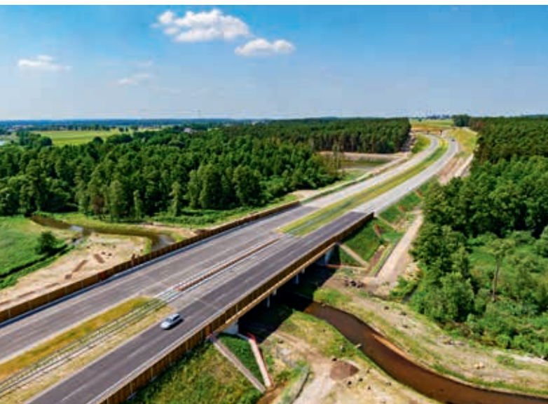
S17 Warszawa – Lublin

Rok 2019 GDDKiA zakończyła, realizując 80 zadań drogowych o łącznej długości ponad 960 km. Udostępniono do ruchu 460 km nowych dróg. Obecnie kierowcy mają do dyspozycji 4121,3 km dróg szybkiego ruchu, w tym 1696,2 km autostrad i 2425,1 km dróg ekspresowych. W 2019 r. podpisano dziewięć umów na budowę 160,8 km dróg łącznie i ogłoszono 34 postępowania przetargowe na zadania o łącznej długości 480,3 km.