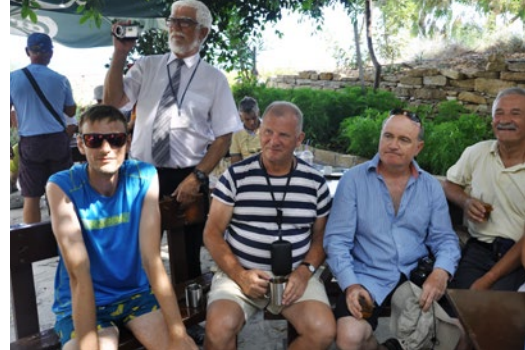
Finisaż naszej wyprawy w ogrodzie tawerny przy skale Afrodyty