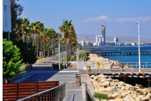
Widok Limassol z mariny