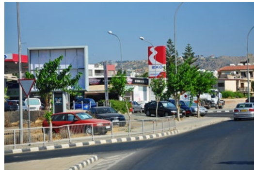
W drodze z Limassol do Pafos