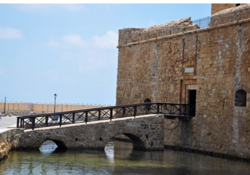
Mostek kamienny oraz żelazny most zwodzony do zamku w Pafos z XII w. (obiekt nr 16)