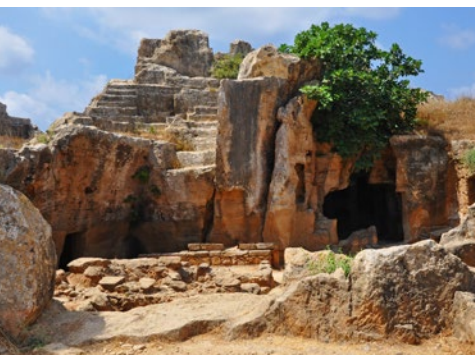
Wejście na teren grobów królewskich z IV w. p.n.e. na terenie Nea Pafos