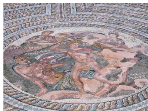
Mozaiki rzymskie z III w. p.n.e. w domu Ajona na terenie Kato Pafos