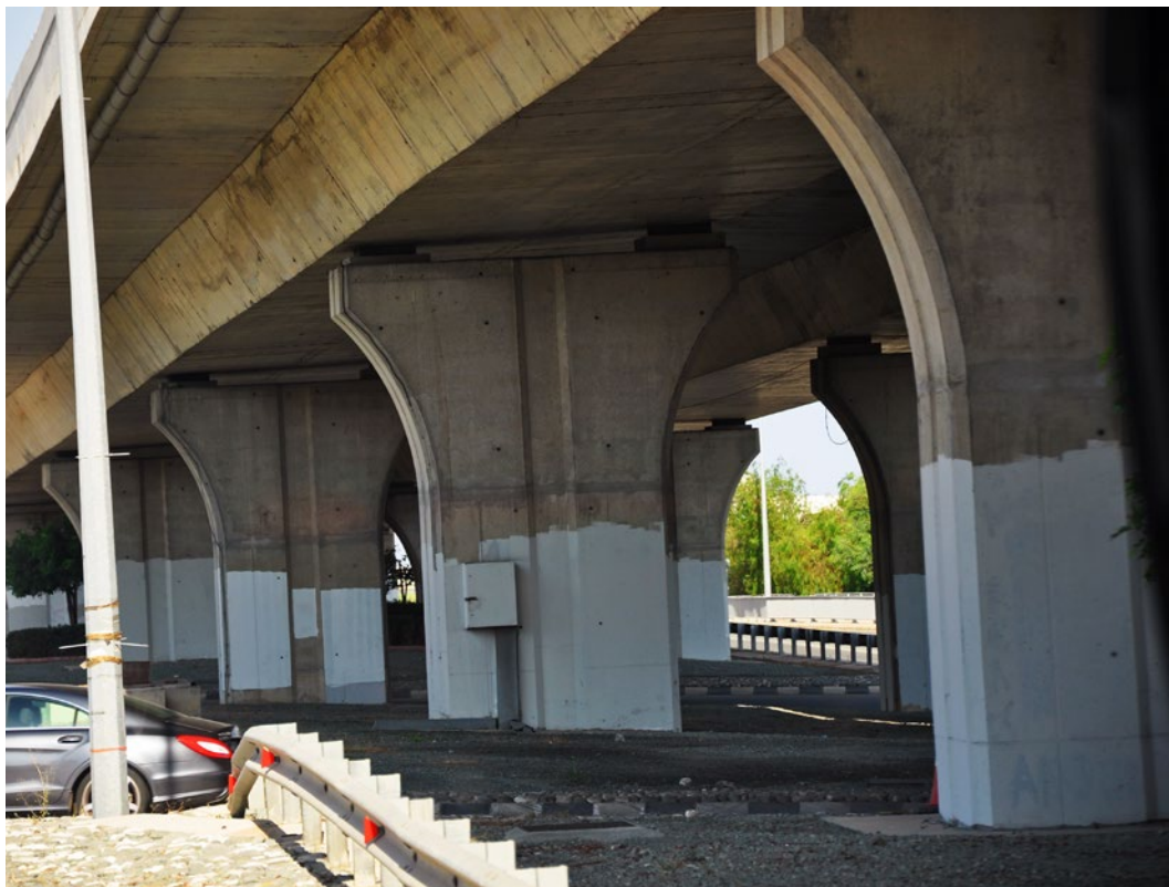
Szczegóły obiektu nr 17