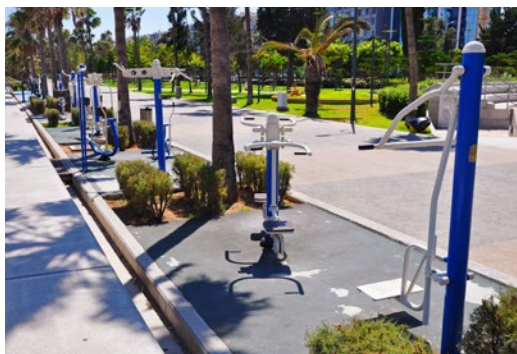
Aleja nadmorska w Limassol z urządzeniami do ćwiczeń sportowych