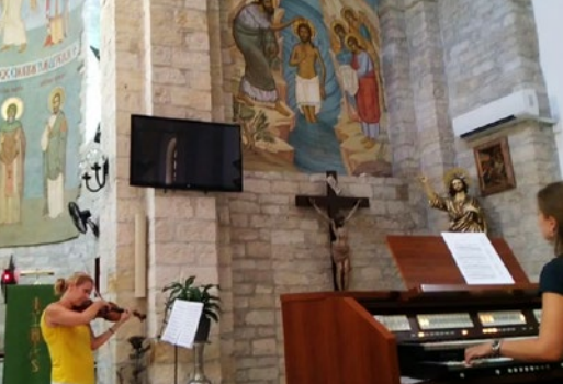
Kościół św. Katarzyny Aleksandryjskiej w Limassol