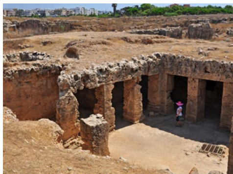
Groby królewskie w Nea Pafos