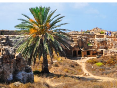
Teren grobów królewskich w Nea Pafos