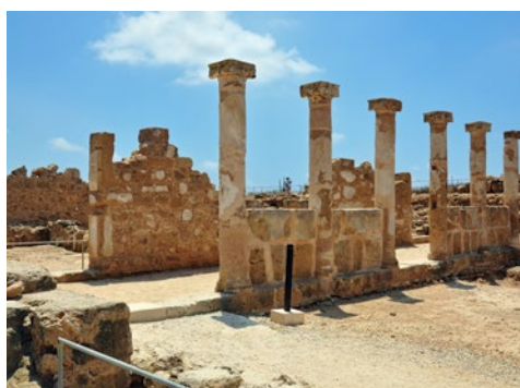
Wykopaliska archeologiczne w Nea Pafos