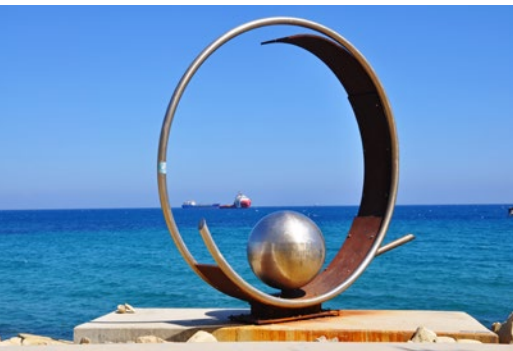
Rzeźby wzdłuż alei nadmorskiej w Limassol