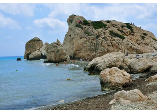
Skała Afrodyty (Petra tou Romiou)