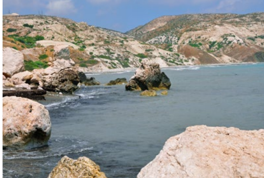
Otoczenie zatoki ze skałą Afrodyty