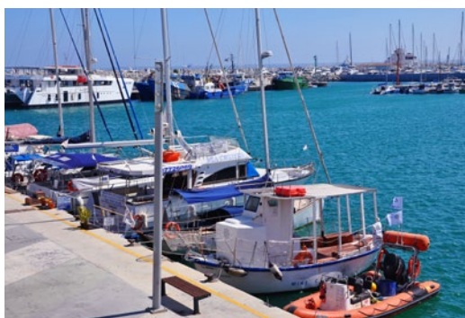
Marina w Limassol