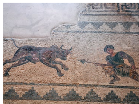
Mozaiki rzymskie z III w. p.n.e. w domu Ajona na terenie Kato Pafos