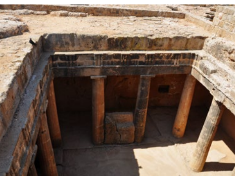
Groby królewskie w Nea Pafos