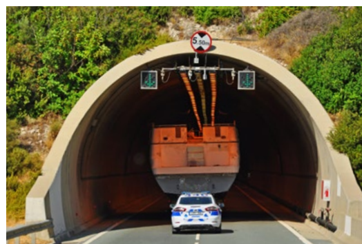
Tunel drogowy na trasie Limassol – Pafos (obiekt nr 15)