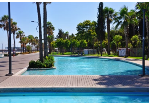
Baseny wzdłuż alei nadmorskiej w Limassol