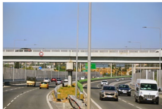
Typowy obiekt mostowy nad autostradą Limassol – Pafos (obiekt nr 13)