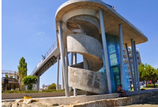
Schody wejściowe na obiekt nr 5