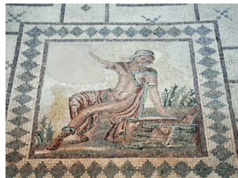
Mozaiki rzymskie z III w. p.n.e. w domu Ajona na terenie Kato Pafos