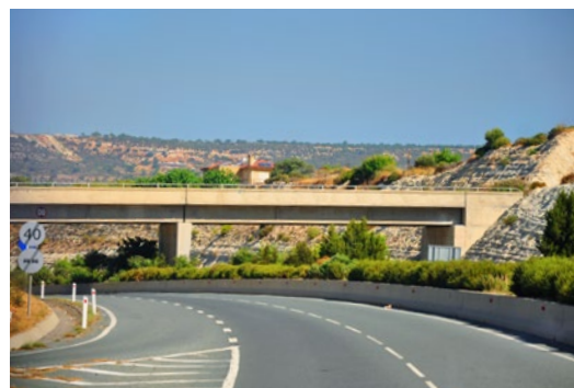
Typowy obiekt mostowy nad autostradą Limassol – Pafos (obiekt nr 14)