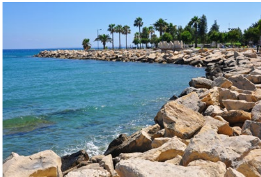
W drodze z mariny do hotelu Odysseia w Limassol