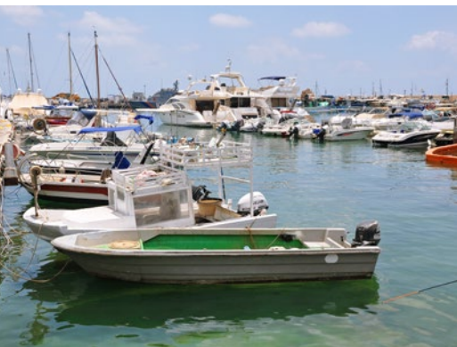
Marina w Pafos