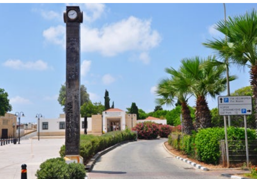
Aleja nadmorska w Pafos