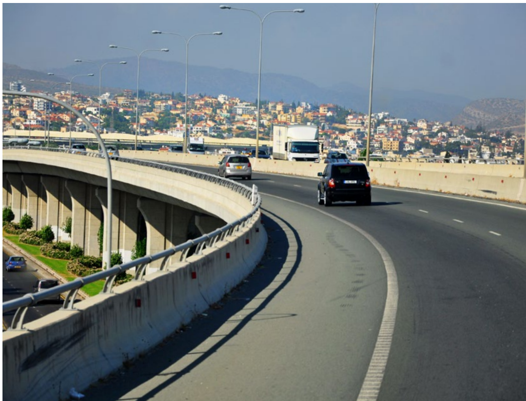
Powrót do hotelu w Limassol (obiekt autostradowy nr 17)