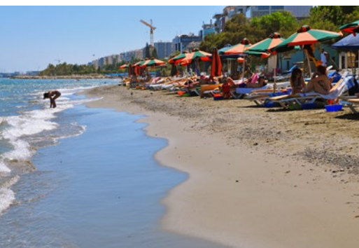
Plaża w Limassol