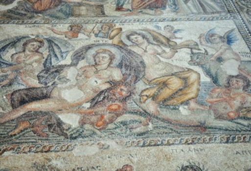
Mozaiki w domu Tezeusza na terenie Kato Pafos