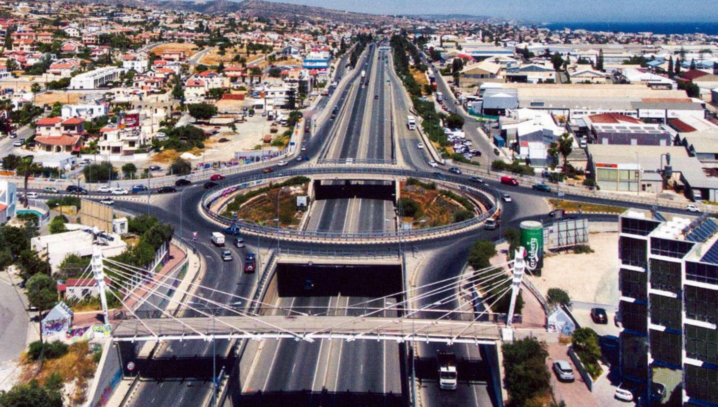
Podwieszona kładka dla pieszych (obiekt nr 11) i tunel drogowy (obiekt nr 12) w centrum Limassol