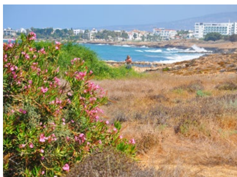
Widok Pafos z rejonu grobów królewskich