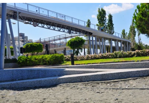
Kręta kładka dla pieszych w Limassol (obiekt nr 5)