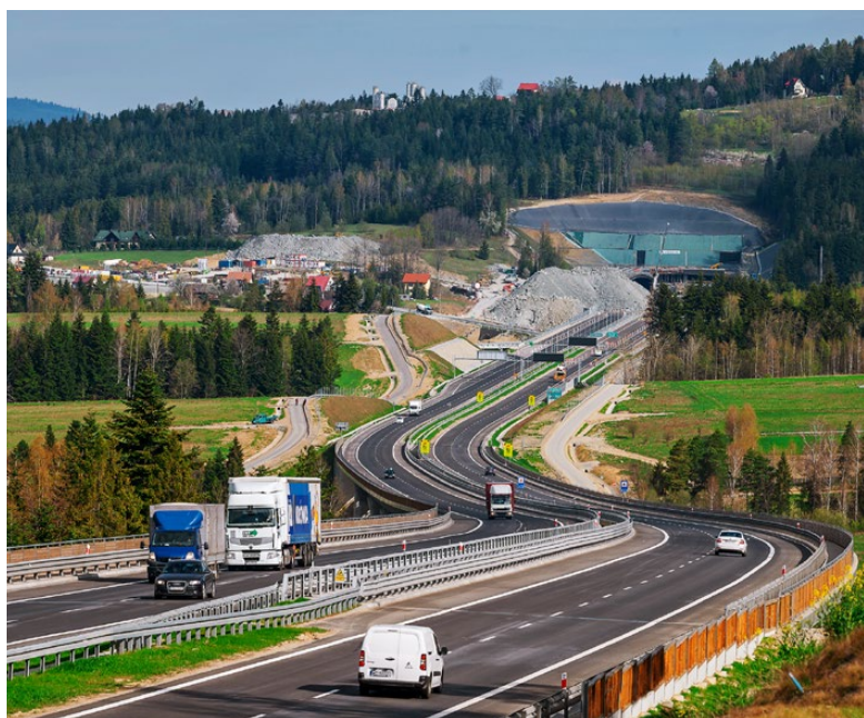
Portal południowy tunelu na S7, Naprawa – Skomielna Biała, fot. K. Nalewajko, GDDKiA