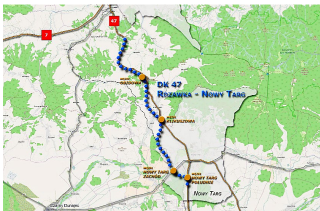
Wizualizacja węzła Klikuszowa i przebiegu trasy

Droga powstająca w nowym śladzie umożliwi szybsze i bezpieczniejsze połączenie Podhala i Zakopanego z innymi regionami kraju. Powstaje dwujezdniowa droga klasy GP o długości ponad 16,1 km, szerokości jezdni 2 x 3,5 m, z czterema węzłami drogowymi (Obidowa, Klikuszowa, Nowy Targ Zachód, Nowy Targ Południe) oraz 27 obiektami inżynierskimi. Budowane są drogi obsługujące tereny przyległe do inwestycji, infrastruktura dla pieszych i rowerzystów, kanalizacja i odwodnienie oraz urządzenia ochrony środowiska (ekrany akustyczne, przejścia dla zwierząt). Przebudowie podlega również infrastruktura techniczna. Obecnie trwają roboty ziemne na ciągu głównym, węzłach, a także zbrojenia i betonowanie podpór obiektów mostowych. Zakończenie budowy zaplanowane jest jesienią 2023 r.