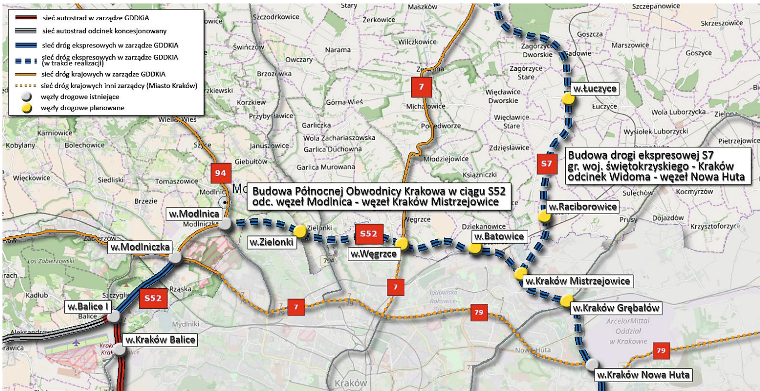
S52, Północna Obwodnica Krakowa