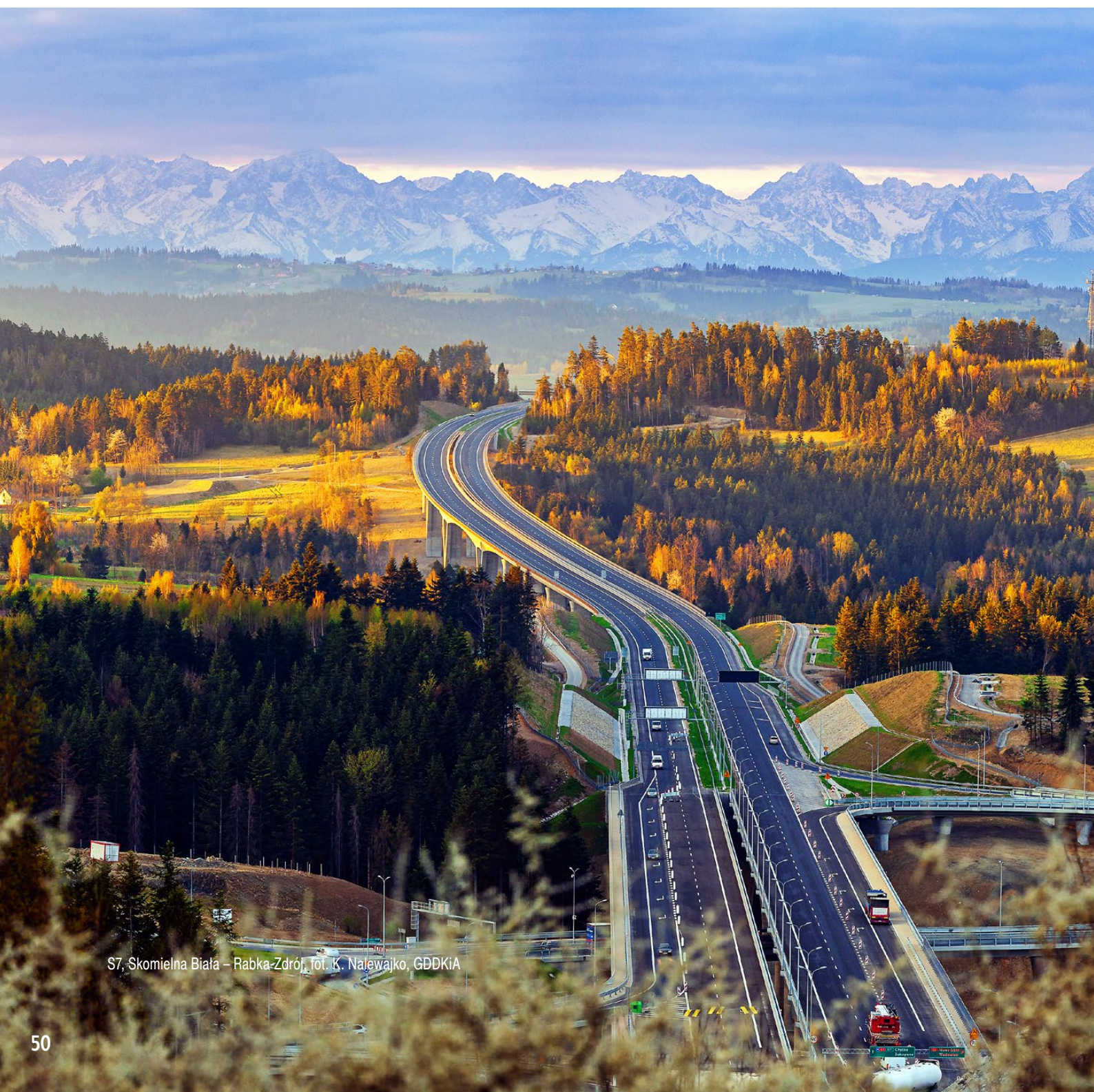
S7, Skomielna Biała – Rabka-Zdrój

W Małopolsce w trakcie realizacji jest ponad 78 km dróg ekspresowych oraz prawie 31 km dróg dwujezdniowych klasy GP. Koszt tych inwestycji wynosi ponad 7,7 mld zł. W 2020 r. ukończono budowę nowego węzła Niepołomice na A4 i obwodnicę Dąbrowy Tarnowskiej. Powstały nowe ronda i chodniki, przebudowano skrzyżowania, wyremontowano ponad 30 km nawierzchni. Podpisano umowy na przygotowanie dokumentacji projektowych dla następnych inwestycji.