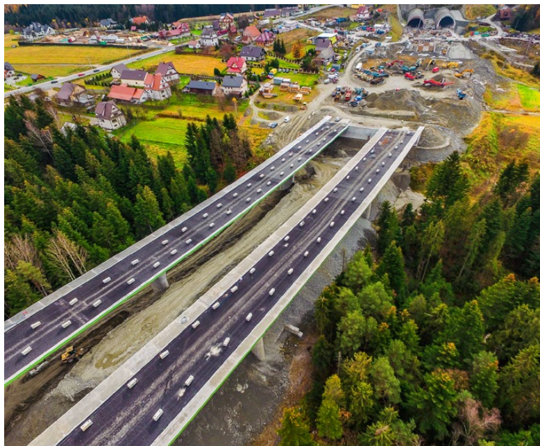
Portal północny tunelu na S7, Naprawa – Skomielna Biała