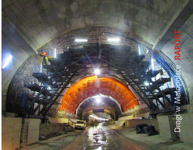
Budowa tunelu na S7