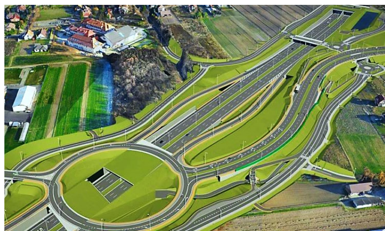
Wizualizacje S52, Północna Obwodnica Krakowa