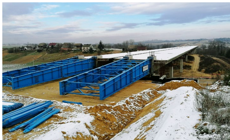
Budowa S7, Szczepanowice – Widoma

13 listopada 2018 r. podpisana została umowa z wykonawcą na realizację drogi. 9 lipca 2020 r. Wojewoda Małopolski wydał zezwolenie na realizację inwestycji drogowej (ZRID) dla części odcinka, od miejscowości Zielonki do Mistrzejowic. Obecnie prowadzone są badania archeologiczne, prace ziemne, trwają już prace przy budowie tunelu w Batowicach. Tunel zostanie wybudowany metodą wykopową. S52 Północna Obwodnica Krakowa będzie miała długość ponad 12 km, dwie jezdnie