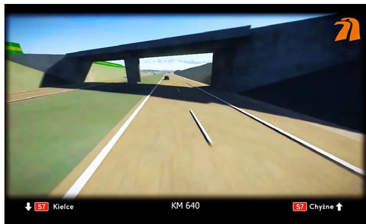
Wizualizacje S7, Szczepanowice – Widoma

Zezwolenie na realizację odcinka Widoma – Kraków Wojewoda Małopolski przekazał GDDKiA 20 lipca 2020 r. W związku z brakiem należytego wykonywania robót i pozytywnej reakcji na wezwania do poprawy oraz powstałą zwłoką w realizacji prac, 4 grudnia 2020 r. odstąpiono od umowy z firmą Webuild (poprzednia nazwa Salini). 23 grudnia 2020 r. wysłano do Dziennika Urzędowego UE ogłoszenie o przetargu na kontynuację projektowania i budowy drogi ekspresowej S7 na tym odcinku.