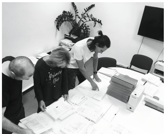
Zespół projektowy tuż przed wydaniem dokumentacji projektowej. Obecnie cały zespół SANMED-u tworzy blisko 40 osób