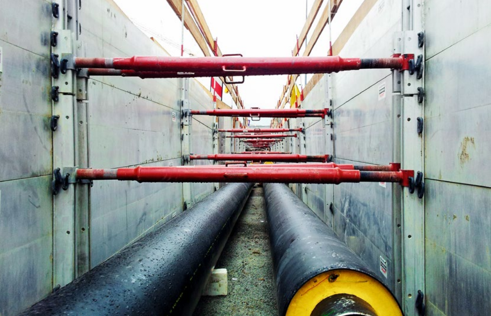
Zabezpieczenie wykopu przy użyciu szalunków aluminiowych LITEBOX