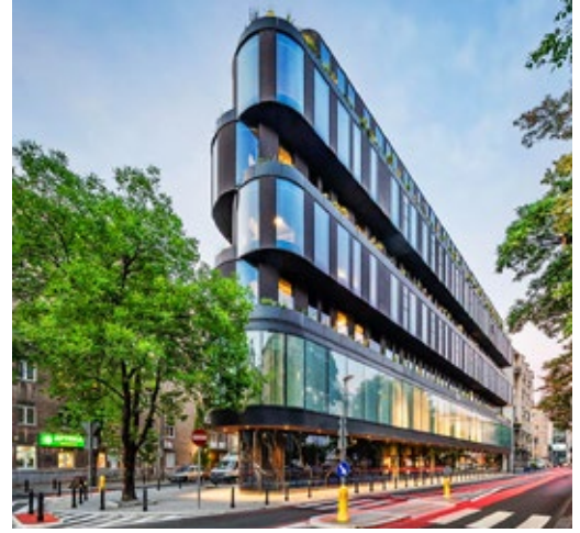
Hotel Nobu Warsaw – II nagroda