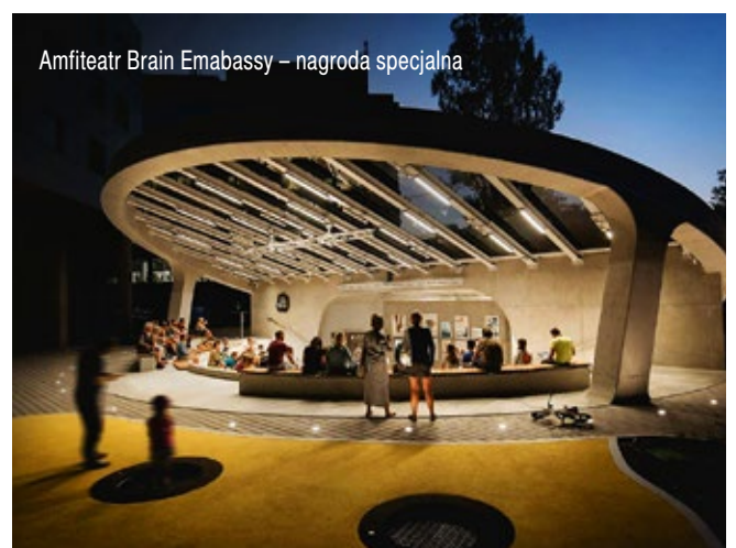
Amfiteatr Brain Embassy – nagroda specjalna