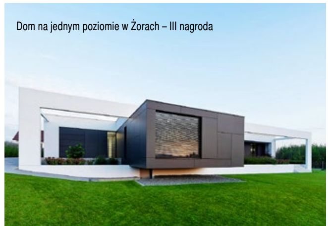
Dom na jednym poziomie w Żorach – III nagroda