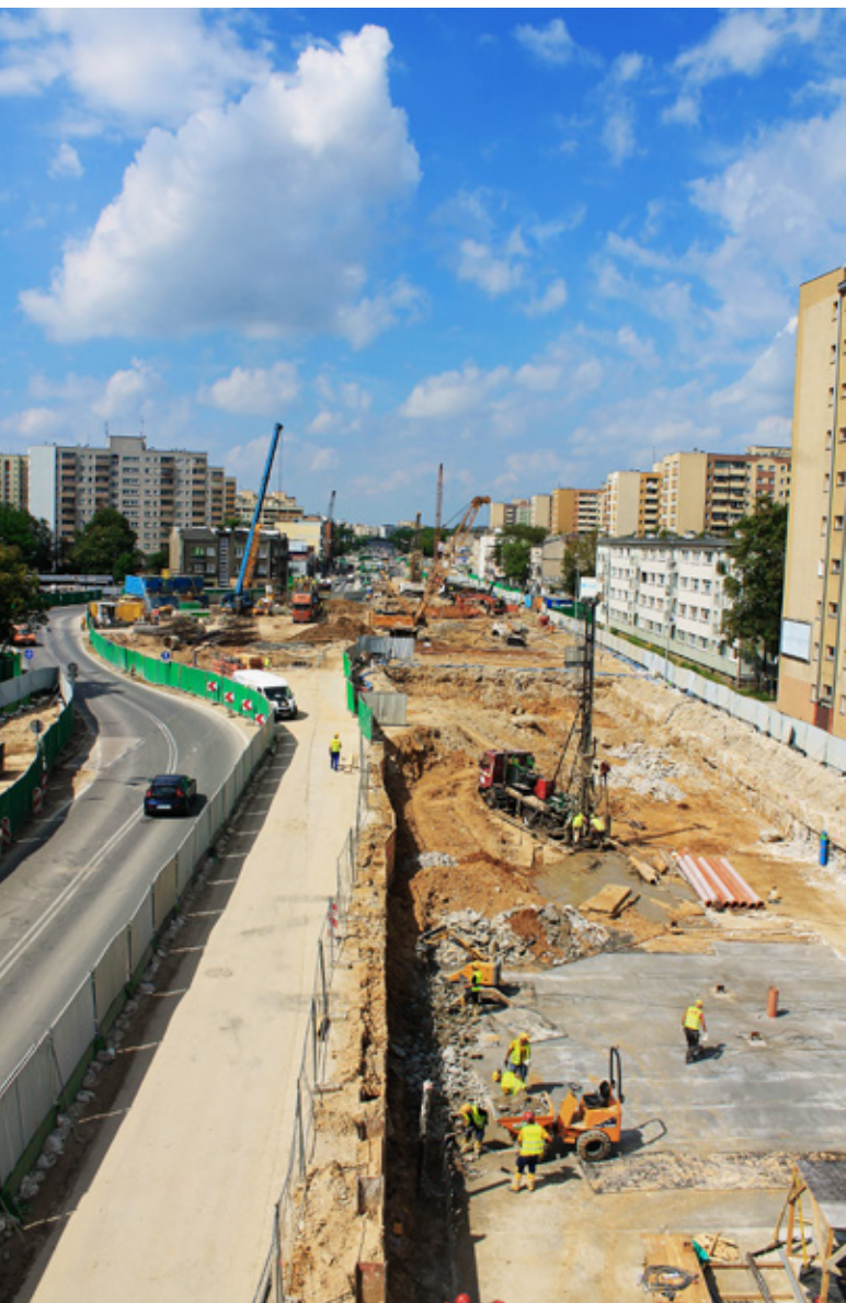
Ryc. 1. Realizacja stacji C06 Księcia Janusza

W 2022 r. do użytku zostało oddanych kolejnych pięć stacji II linii metra w Warszawie. W czerwcu na odcinku zachodnim otwarto stacje C04 Ulrychów oraz C05 Bemowo, natomiast od września pasażerowie mogą także korzystać z przystanków C19 Zacisze, C20 Kondratowicza oraz ostatniej na prawym brzegu Wisły – C21 Bródno.