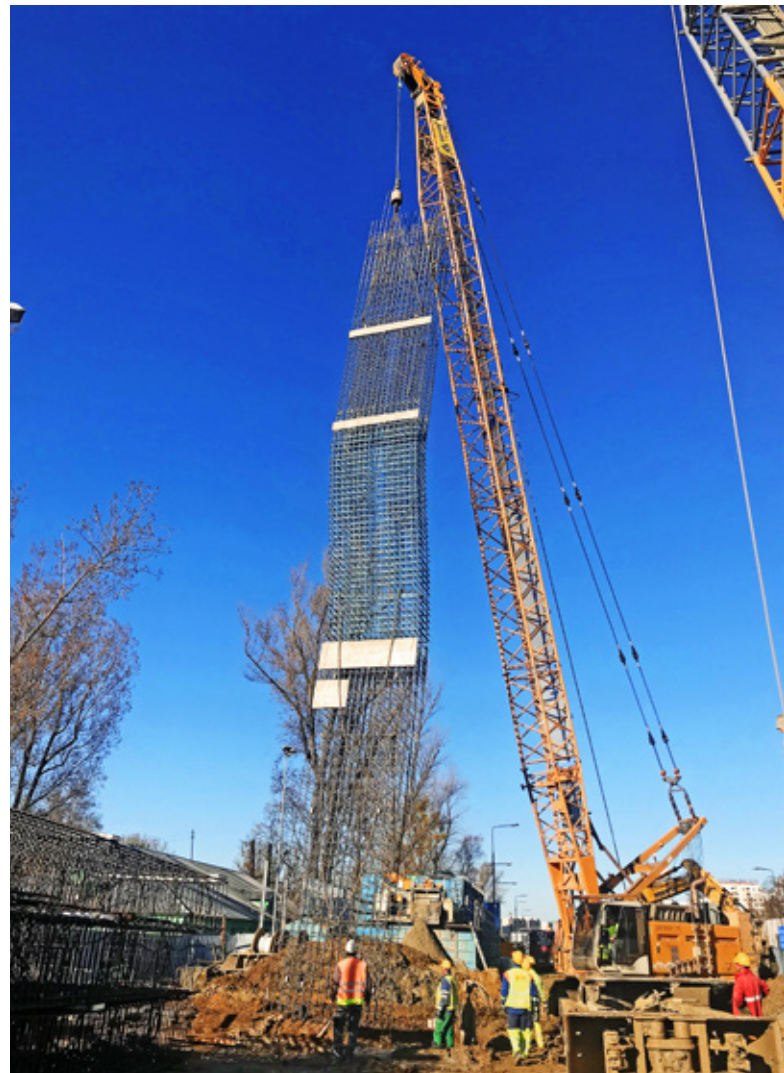
Ryc. 3. Montaż kosza zbrojeniowego z prętów stalowych oraz GFRP w miejscu przejścia tarczy TBM przez ścianę korpusu stacji

gówek Mieszkaniowy. Najdłuższe sekcje ścian szczelinowych osiągnęły głębokość 48,0 m (stacje C08 i C17) i są jednymi z najgłębszych w naszym kraju. Należy też dodać, że ściany szczelinowe są wykorzystywane również w innych obiektach metra. Ze względu na sposób rozbudowy sieci kolei podziemnej w Warszawie za skrajną stacją każdego realizowanego etapu konieczne było wybudowanie komór dla torów odstawczych metra. Stump Franki była odpowiedzialna za ich budowę za stacjami C06 oraz C04. Ostatnim zadaniem w zakresie ścian szczelinowych, jakie zostało powierzone naszej firmie, były wentylatornie V09, V09A, V07, V05 i V18 oraz szyb demontażowy S06. Dodatkowo w obiektach C06 oraz V09 wykonaliśmy poziome przesłony przeciwfiltracyjne w technologii jet grouting.