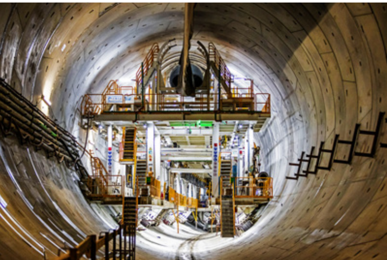
Pierwsza nagroda ex aequo w Branżowym Konkursie Fotograficznym Technologie bezwykopowe w obiektywie w kategorii bezwykopowa budowa dla firmy PORR SA za zdjęcie W tunelu pod Świną