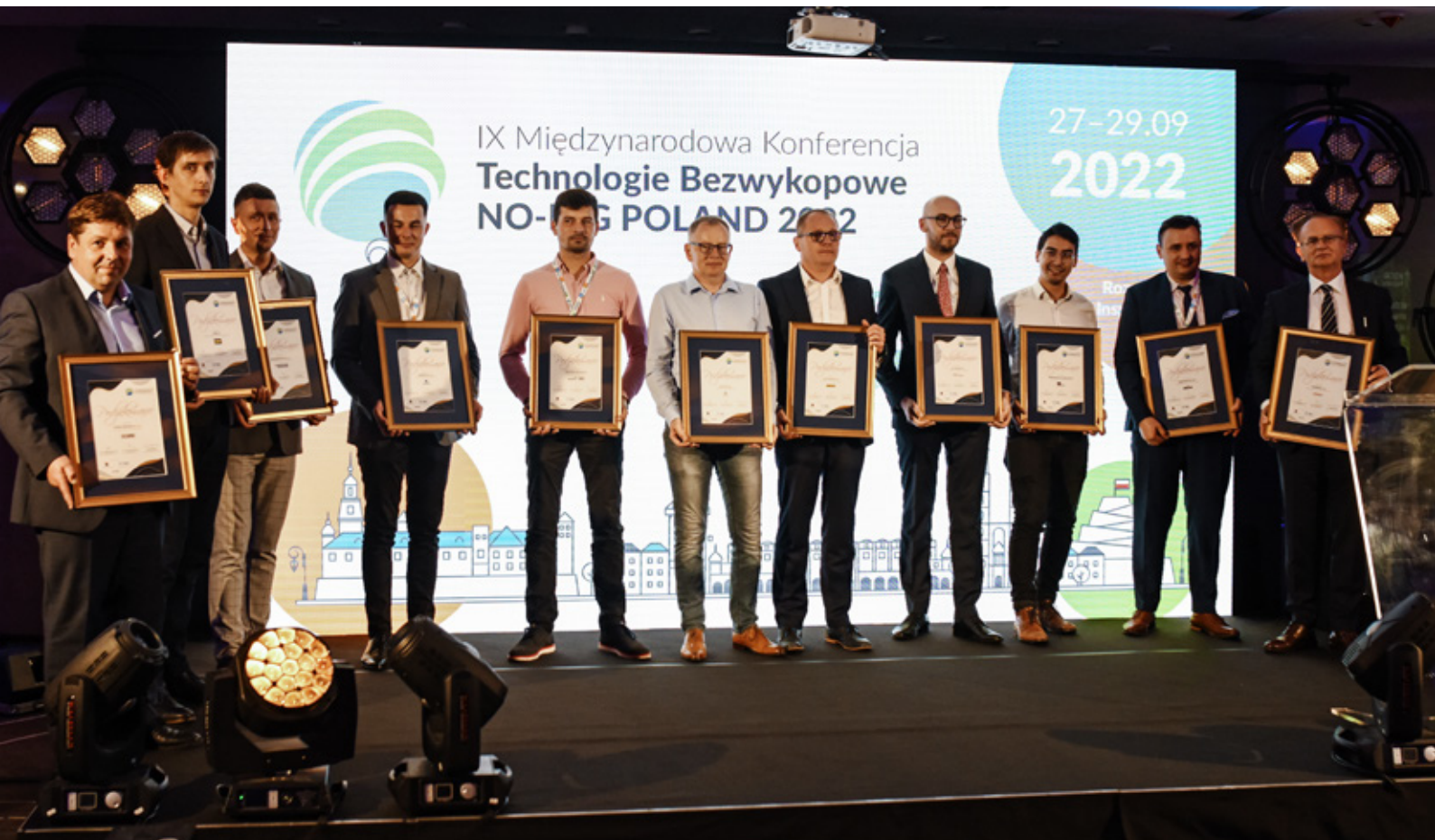
Sponsorzy IX Międzynarodowej Konferencji Technologie Bezwykopowe NO-DIG POLAND