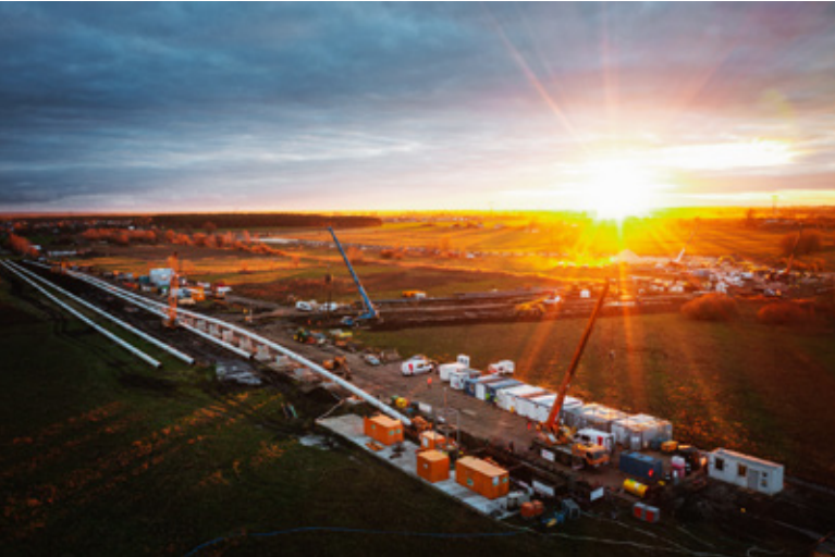
Pierwsza nagroda ex aequo w Branżowym Konkursie Fotograficznym Technologie bezwykopowe w obiektywie w kategorii bezwykopowa budowa dla firmy GGT Solutions SA za zdjęcie Plac budowy o zachodzie słońca z przekroczenia Warty w Ciecierzycach