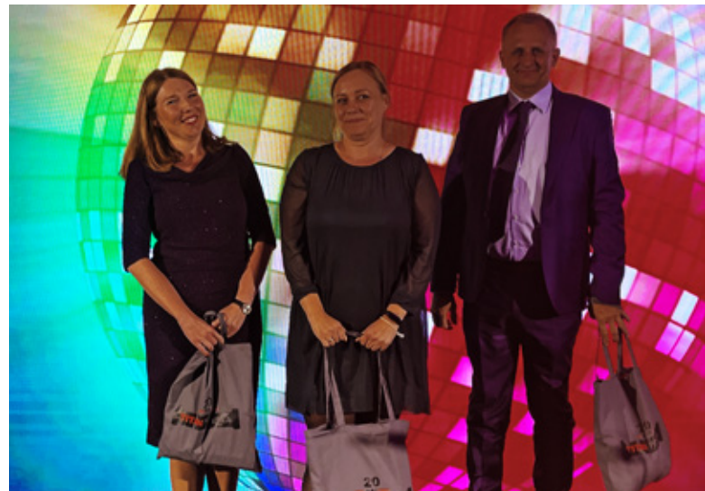
Zwycięzcy konkursu Safety First – bezpieczeństwo pracy w wykopie zorganizowanego przez Titan Polska Sp. z o.o.