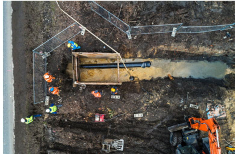
W Branżowym Konkursie Fotograficznym Technologie bezwykopowe w obiektywie w kategorii bezwykopowa budowa wyróżnienie otrzymała firma Saint-Gobain PAM za zdjęcie Przewiert HDD w Gliwicach za pomocą rury TT PE Direxional